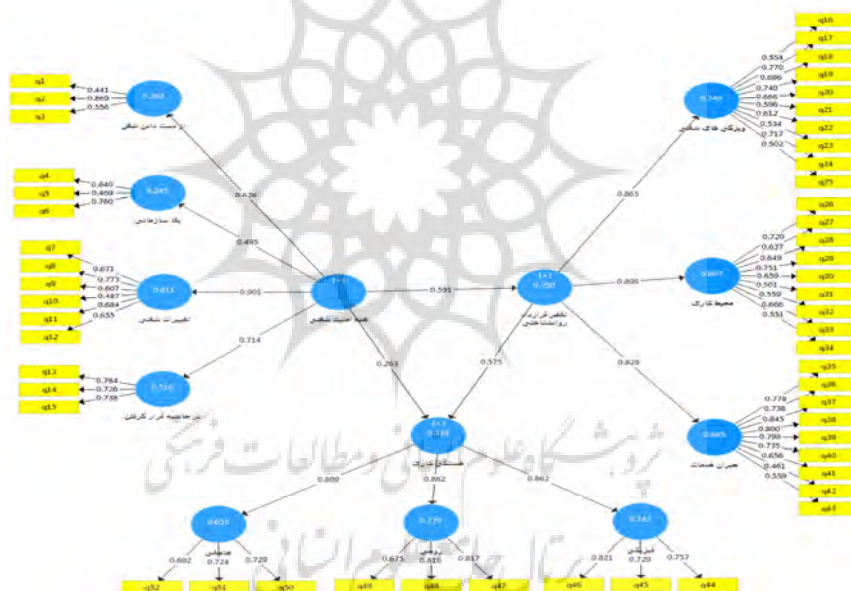
شکل ۲. مدل معادلات ساختاری پژوهش (تخمین استاندارد)