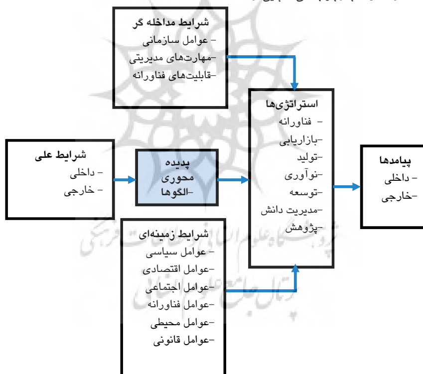
شکل ۵. چارچوب همپایی فناورانه: مبتنی بر نظریه داده بنیاد و فراترکیب

دارند. پنجمین مقوله، استراتژی‌هایی است که در زمینه همپایی در مقالات به آن اشاره شده است. این استراتژی‌ها در قالب ۷ استراتژی کلی دسته بندی شده‌اند. این استراتژی‌ها عبارتند از استراتژی‌های تکنولوژیکی، استراتژی‌های بازاریابی، استراتژی‌های تولید، استراتژی‌های نوآوری، استراتژی‌های توسعه، استراتژی‌های مدیریت دانش و استراتژی تحقیقات. بیشترین کدهای یافت شده متعلق به استراتژی‌های توسعه است که در بین آن نیز به سرمایه‌گذاری‌های جدید اهمیت زیادی داده شده است. کمترین کد نیز متعلق به استراتژی‌های تحقیقاتی است. آخرین مقوله نیز، نتایج و پیامدهای حاصل از استراتژی‌های همپایی است. این پیامدها در دو دسته داخلی و خارجی دسته بندی شده‌اند. مشاهده می‌شود در مقایسه با مقوله‌های دیگر کمتر به این مقوله اشاره شده است. در شکل ۵ چارچوب کلی همپایی ارائه شده است.