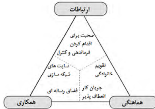
شکل ۱. مدل همکاری و جانمایی ابزارهای ارتباطی

همکاری/مشارکت و همیاری دو مفهوم نزدیک به هم اما متفاوت هستند. آقای اسپچوتل و همکارانش در تحقیقی مطابق شکل ۲ به تفاوت‌های این دو مفهوم پرداخته‌اند. آنها با مرور ادبیات موضوع، این دو مفهوم را از نظر پارامترهای مختلف مورد بررسی قرار داده‌اند. همیاری وضعیتی بین حالت استقلال کامل اعضا و مشارکت است. که بعضی مواقع به سمت استقلال اعضا گرایش دارد و در مواقعی به مشارکت نزدیک می‌شود. مشارکت از منظر عواملی مثل اعتماد، ارتباطات، تعهد، اشتراک دانش و تبادل اطلاعات قوی‌تر از همیاری است [۱۴].