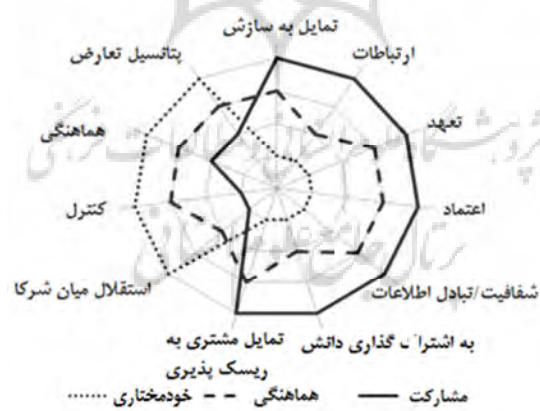
شکل ۲. مقایسه شدت پارامترهای مختلف در دو مفهوم همکاری و همیاری

همکاری/مشارکت و همیاری دو مفهوم نزدیک به هم اما متفاوت هستند. آقای اسپچوتل و همکارانش در تحقیقی مطابق شکل ۲ به تفاوت‌های این دو مفهوم پرداخته‌اند. آنها با مرور ادبیات موضوع، این دو مفهوم را از نظر پارامترهای مختلف مورد بررسی قرار داده‌اند. همیاری وضعیتی بین حالت استقلال کامل اعضا و مشارکت است. که بعضی مواقع به سمت استقلال اعضا گرایش دارد و در مواقعی به مشارکت نزدیک می‌شود. مشارکت از منظر عواملی مثل اعتماد، ارتباطات، تعهد، اشتراک دانش و تبادل اطلاعات قوی‌تر از همیاری است [۱۴].