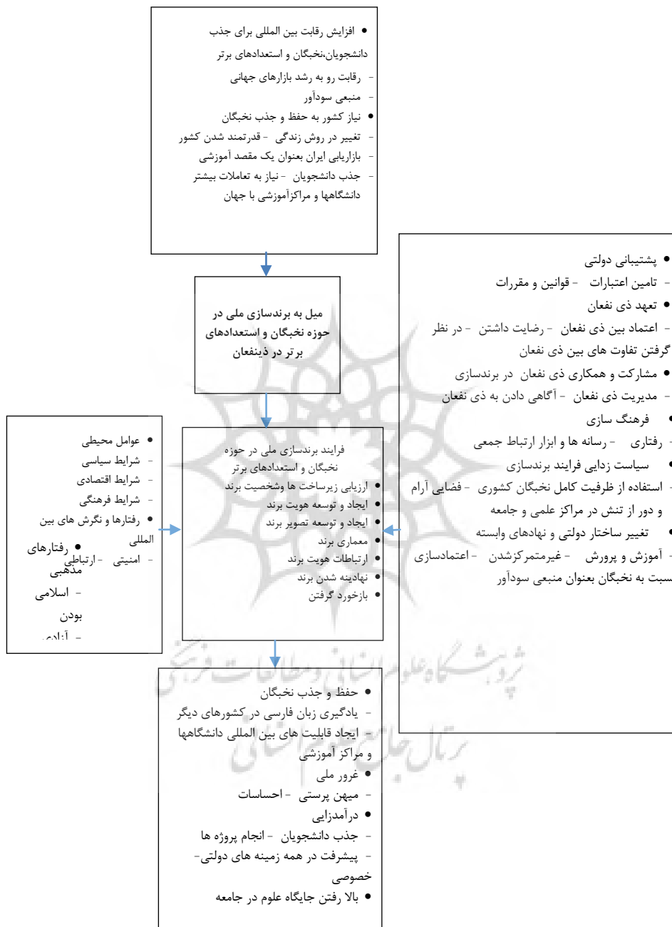
شکل ۲: کدگذاری محوری مبتنی بر مدل پارادایم