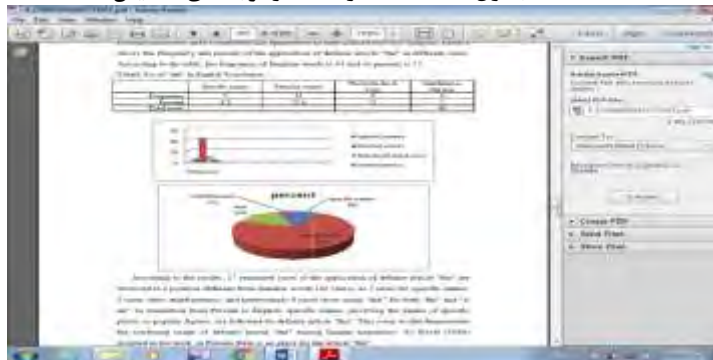
جدول ۱. استفاده از the در ترجمه ی انگلیسی

بر اساس نتایج، ۱۷ مورد باقی مانده از کاربرد حرف تعریف معلوم "the" در موارد متفاوت با کلمات آشنا (۴۳ مورد) همانند ۵ مورد برای نام های خاص استفاده شده است ۳ مورد بیانگر نام معلوم بودن است، و جالب توجه است که ۹ مورد با استفاده از "that" برای هر دو "a. an" the" مرتبط است. در ترجمه از فارسی به انگلیسی، نامهای خاصی که شامل نام مکان خاص یا شخصیت های محبوب هستند با حرف تعریف معلوم "the" مشخص شده اند. این موضوع نشان دهنده ی استفاده گیج کننده از حرف تعریف معلوم "the" در میان مترجمین ایرانی است. همانطور که Boyle (۱۹۶۶) در کتاب خود اظهار داشته است، در زبان فارسی هیچ جایگاهی برای حرف تعریف "the" وجود ندارد. به این ترتیب Boyle (۱۹۶۶. p. ۱۶) تلاش کرد تا نشان دهد که مشخص بودن در فارسی با زبان انگلیسی متفاوت است، زیرا ممکن است در موارد زیر نشان داده شود: