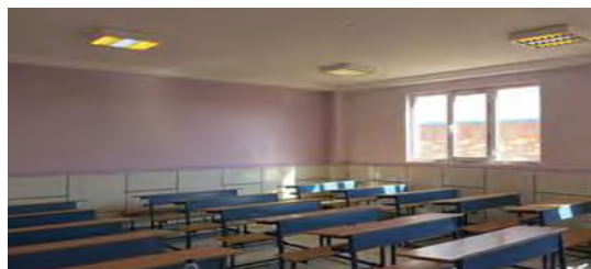
شکل ۱- تصویر بدون فایده