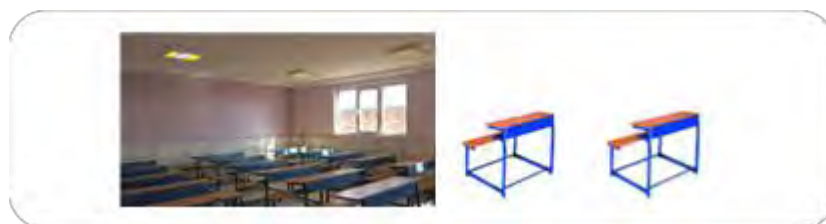
شکل ۳- تصویر ضروری

تصویر استنتاج شود. همچنین دانش‌آموزان اطلاعات بی‌ربط تصویر را نادیده گرفته، اطلاعات را از دو منبع (شکل و صورت مسئله) تلفیق و استنباط کرده و مسئله را حل می‌کنند (شکل ۳).