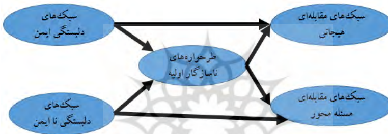
شکل ۱: مدل مفهومی ارتباط بین سبک‌های دلبستگی، مقابله‌ای و طرح‌واره‌های ناسازگار اولیه

با توجه به این که سبک‌های دلبستگی و سبک‌های مقابله‌ای و طرح‌واره‌های ناسازگار اولیه در شکل‌گیری و گرایش افراد به اعتیاد نقش مهمی دارد؛ لذا انجام تحقیق حاضر می‌تواند ضمن شناسایی سبک‌های مقابله‌ای و دلبستگی معتادان مراجعه‌کننده به مراکز ترک اعتیاد شهرستان ابهر، مهم‌ترین سبک‌های مقابله‌ای و دلبستگی این افراد را شناسایی کند و گامی مؤثر در جهت گسترش مفهوم دلبستگی و سبک‌های مقابله‌ای این معتادان برداشته شود. از نتایج به دست آمده می‌توان برای افزایش دانش در راستای پیشگیری و درمان بیماری اعتیاد استفاده نمود. با توجه به موارد بیان شده مدل پیشنهادی مطابق با شکل ۱ می‌باشد.