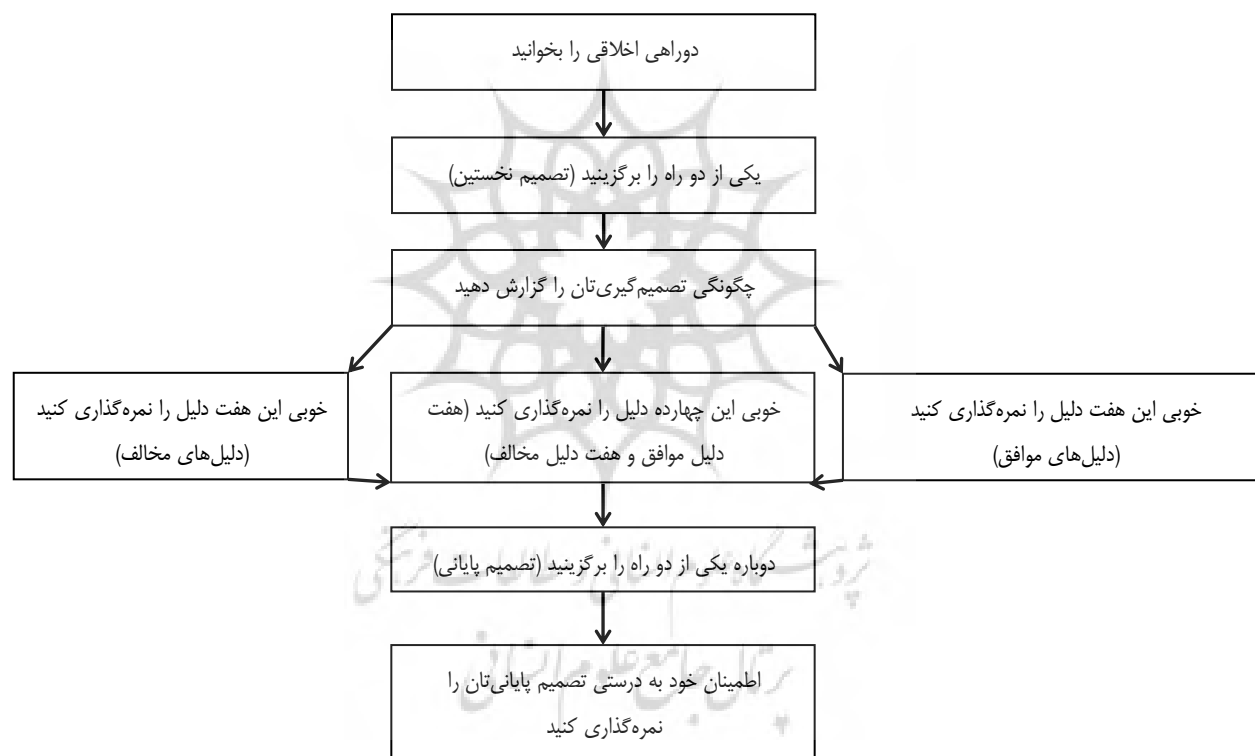
شکل ۱. نمودار طرح آزمایش

را بیان کنند: «با دلیل»، «با احساس»، یا «با شیوه‌ای دیگر». سپس آزمودنی‌ها به‌طور تصادفی به سه گروه گمارده شدند: به یک گروه، هفت دلیل موافق تصمیمی که گرفته بودند داده شد (مثلاً اگر یک آزمودنی خفه کردن نوزاد را انتخاب کرده بود، هفت دلیل برای خفه کردن نوزاد به او داده شد)؛ به گروه دیگر، هفت دلیل مخالف تصمیمی که گرفته بودند داده شد (مثلاً اگر یک آزمودنی خفه کردن نوزاد را انتخاب کرده بود، هفت دلیل برای خفه نکردن نوزاد به او داده شد)؛ و به گروه سوم، چهارده دلیل، یعنی هفت دلیل برای خفه کردن و هفت دلیل برای خفه نکردن نوزاد داده شد. از آزمودنی‌ها خواسته شد که «خوبی» هر