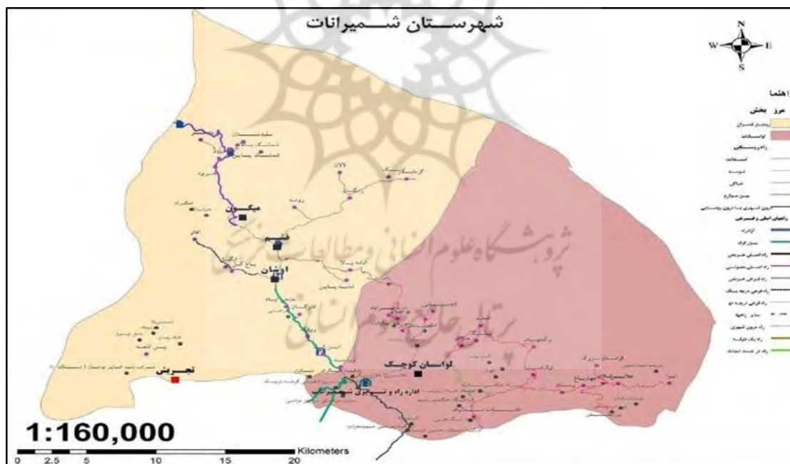
نقشه شماره ۲- شهرستان شمیرانات

مساحت شهرستان به تقریب حدود ۱۱۱۱ کیلومتر مربع و ۵/۹ درصد مساحت استان است؛ و در بین ۱۴ شهرستان استان تهران، مقام پنجم را دارد. از این مساحت، حدود ۶۰ کیلومتر مربع مربوط به شهر شمیران شامل منطقه یک و غرب منطقه چهار شهرداری تهران بزرگ، حدود ۶۰۰ کیلومتر مربع مساحت بخش لواسان و حدود ۵۰۰ کیلومتر مربع مساحت بخش رودبار قصران است.