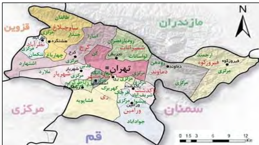
نقشه شماره ۱- موقعیت شهرستان شمیرانات