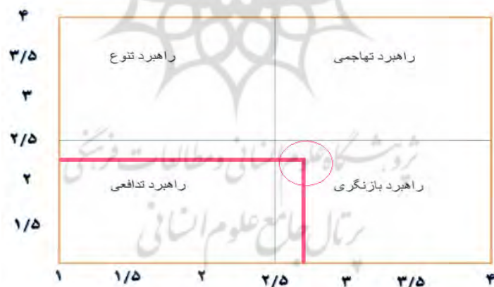
شکل (۳) - ماتریس ارزیابی نهایی عوامل داخلی و خارجی مؤثر بر چالش‌های مدیریتی کلانشهر تهران با رویکرد مدیریت یکپارچه شهری

الف) جمع امتیاز نهایی ماتریس ارزیابی عوامل داخلی که بر روی محور X ها نشان داده می‌شود؛ و ب) جمع امتیاز نهایی ماتریس ارزیابی عوامل خارجی که بر روی محور Y ها نوشته می‌شود (ابراهیم‌زاده و همکاران، ۱۳۹۰: ۱۲۱). در پژوهش حاضر، جمع امتیاز نهایی ارزیابی عوامل داخلی مؤثر بر ایجاد مدیریت یکپارچه در کلانشهری تهران (۲/۶۷) می‌باشد، بر روی محور X ها و جمع امتیاز نهایی عوامل خارجی مؤثر بر ایجاد مدیریت یکپارچه در کلانشهری تهران (۲/۲۵) می‌باشد، بر روی محور Y ها نشان داده شده است که نقطه تلاقی آن‌ها مشخص کننده نوع راهبرد می‌باشد شکل (۳). همان‌طوری که مشخص است نقطه تلاقی جمع امتیازهای نهایی عوامل داخلی و خارجی، در خانه راهبرد بازنگری قرار گرفته است بنابراین باید راهبردهای بازنگری را به اجرا درآورد که به سبب آن باید تمام تلاش در جهت کاهش نقاط ضعف درونی مدیریت یکپارچه در کلانشهر تهران با بهره‌گیری از فرصت‌های بیرونی است.