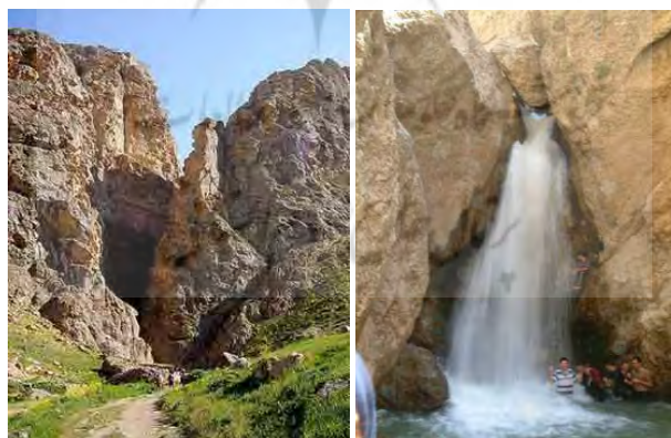
شکل ۳: نمایی از تنگه واشی

غار بورنیک: این غار مهم‌ترین غار ناحیه شرق است که در فاصله ۶ کیلومتری از روستای هرانده در جنوب غربی شهر فیروزکوه قرار گرفته است. این غار از سه تالار بزرگ تشکیل شده است. دیوارهای درون غار پوشیده از چکنده های گل کلمی، نخودی سفید رنگ و صورتی است و زیبایی خاصی به غار بخشیده است. در بررسی‌های اولیه آثاری از زندگی انسان در درون غار کشف شده است (Housing and Urban Development Organization, 2009: 167).