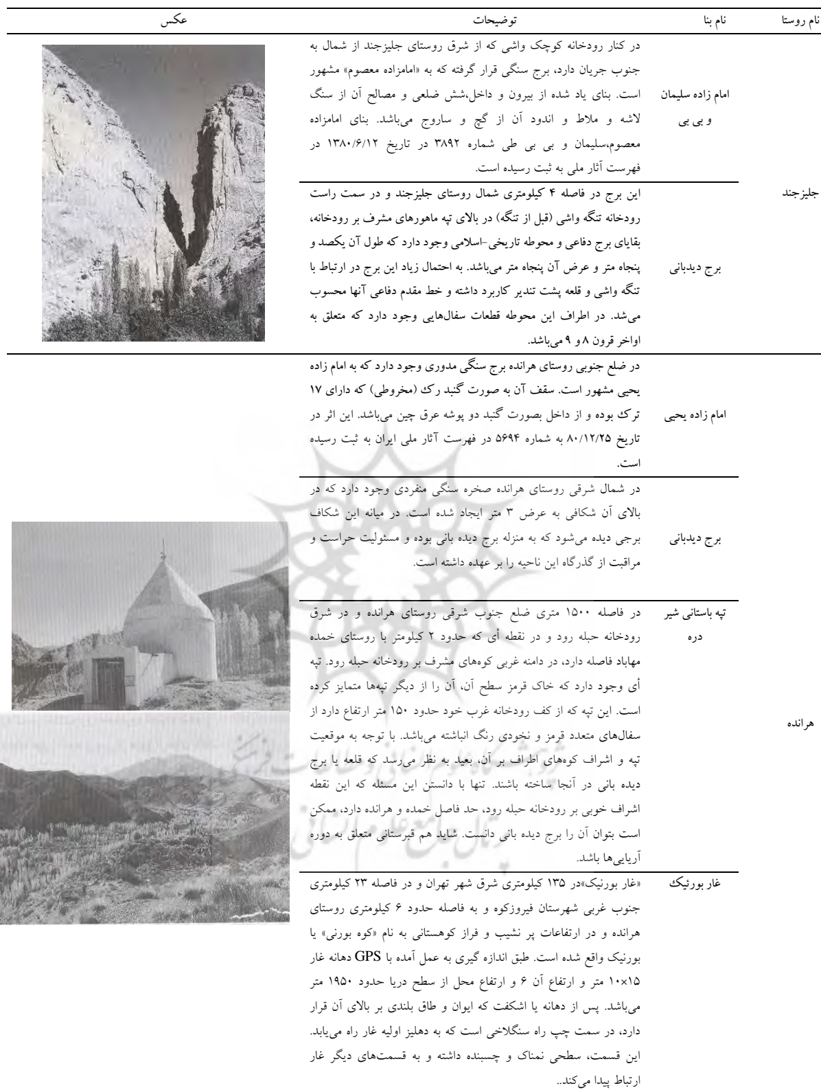
جدول ۷: جاذبه‌های گردشگری روستاهای مورد بررسی