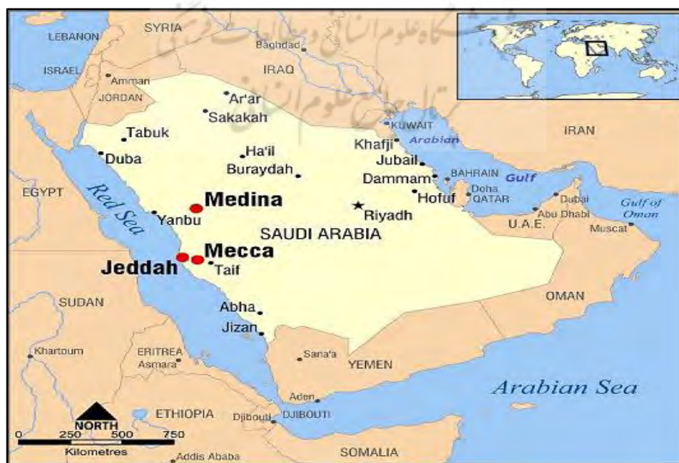
نقشه شماره ۱- موقعیت جغرافیایی عربستان سعودی

کویرها و صحاری وسعت قابل ملاحظه‌ای را به خود اختصاص داده است. مهم‌ترین کویرهای این بخش عبارت‌اند از: صحرای الدهننا، صحرای نفوذ و صحرای ربع الخالی، این صحرا، بزرگ‌ترین صحرای عربستان است و وسعتی را معادل پانصد و شصت هزار کیلومتر مربع اشغال کرده است. به لحاظ آب و هوایی، منطقه عربستان بسیار خشک و سوزان بوده و عموماً با وزش بادهای خشک، تل‌هایی از شن به این سو و آن سو در حرکت است. بارش باران نیز کم بوده و نواحی ساحلی گرم و مرطوب می‌باشد. آب و هوای این کشور، در تابستان بسیار گرم و در زمستان معتدل است. بارندگی به مقدار کم صورت می‌گیرد، به جز در مناطق شرقی که سالیانه ۴۰۰ کیلومتر بارش دارد.