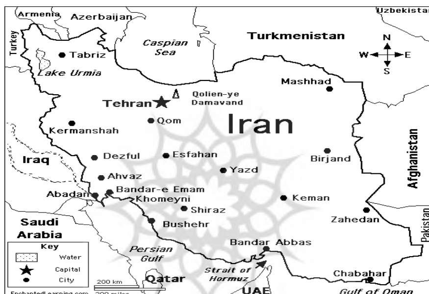
نقشه شماره ۱- مرزهای ایران

جمهوری اسلامی ایران دارای همسایگان متعدد و مرزهای مشترک طولانی با کشورهای همسایه است. از بین ۳۱ استان کشور ۱۶ استان، استان‌های مرزی محسوب می‌شوند که بر اساس آخرین سرشماری در سال ۱۳۹۰ بیش از ۴۵ درصد جمعیت کشور را در خود جای داده‌اند. نیمی از جمعیت کشور در استان‌های مرزی ایران با داشتن بیش از ۸۷۰۰ کیلومتر مرز خشکی و آبی با ۷ کشور عراق، آذربایجان، ارمنستان، ترکمنستان، پاکستان، افغانستان و ترکیه دارای مرز خشکی و با ۶ کشور روسیه قزاقستان (در شمال)، کویت، قطر، امارات متحده عربی و بحرین (در جنوب) دارای مرز آبی است (Akhavi, 2012: 106).