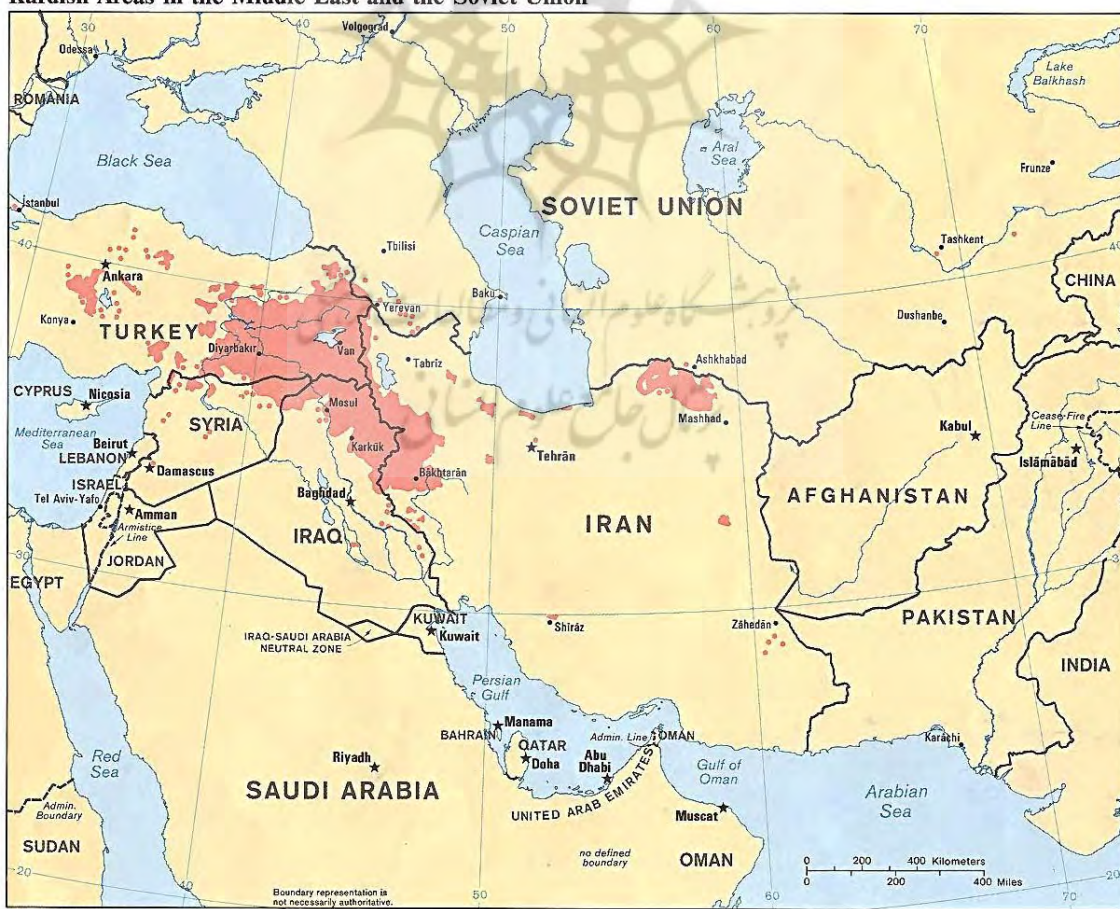
Kurdish Areas in the Middle East and the Soviet Union

حرکت تدریجی آمریکایی‌ها در شمال شرق سوریه برای تحکیم ارتباط با کردها و تشکیل قوات دموکراتیکه السوریا (نیروهای دموکراتیک سوریه) و ایجاد زیرساخت‌های اطلاعاتی، عملیاتی و پروازی، زمینه نقش آفرینی جدید در تحولات سوریه برای کردها رقم زده است البته آنچه مسلم است اینکه کردها در یک پروژه با آمریکاییها در شرق فرات همراه شده‌اند و شاید در رقه هم باقی نمانند و به مناطق جمعیتی و سستی خود بازگردند و تنها به عنوان ابراز مزیت سازی راهبردی برای آمریکا، خود را تعریف کنند تا از اهرم آمریکا هم در سوریه و هم در ترکیه استفاده کنند و در نهایت به هدف خود که ایجاد فدرالیسم کردی از طریق وصل کردن کانتونهای کردی در شمال سوریه است، دسترسی پیدا کنند.