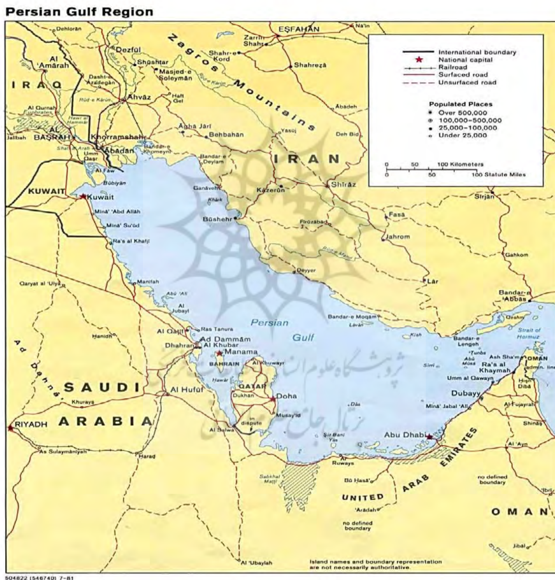
نقشه شماره ۱: موقعیت جغرافیایی خلیج فارس www.persiangulfstudies.com

می‌باشد که در این سطح وظیفه حاکمیت این است که منافع و ارزشهای بنیادین، حیاتی و... جامعه را در مقابل تهدیدات داخلی و خارجی حفظ نماید (Negahiyan, 2013: 5). باری بوزان استدلال می‌کند که «امنیت» از جمله یک مفهوم اساساً مجادله آمیزی است که یکی از ویژگی‌های آن مناظرات و مجادلات غیر قابل حل در مورد معنا و کاربرت آن می‌باشد (Mousavi and salehi, 2015: 35). «آرنولد ولفرز» می‌گوید: امنیت ارزشی است که هر کشوری می‌تواند کم و بیش از آن برخوردار باشد. منظور از امنیت در بعد عینی، فقدان تهدیدهایی است که در مورد دست یابی به ارزش‌ها وجود دارد و در بعد ذهنی، منظور فقدان تهدیدهایی است که ارزش‌ها را مورد هجوم قرار می‌دهند (Ahadi, 2013: 10).