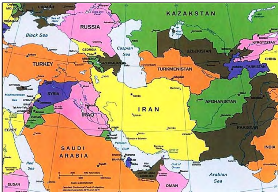
نقشه شماره ۲- جایگاه ژئواستراتژیک ایران