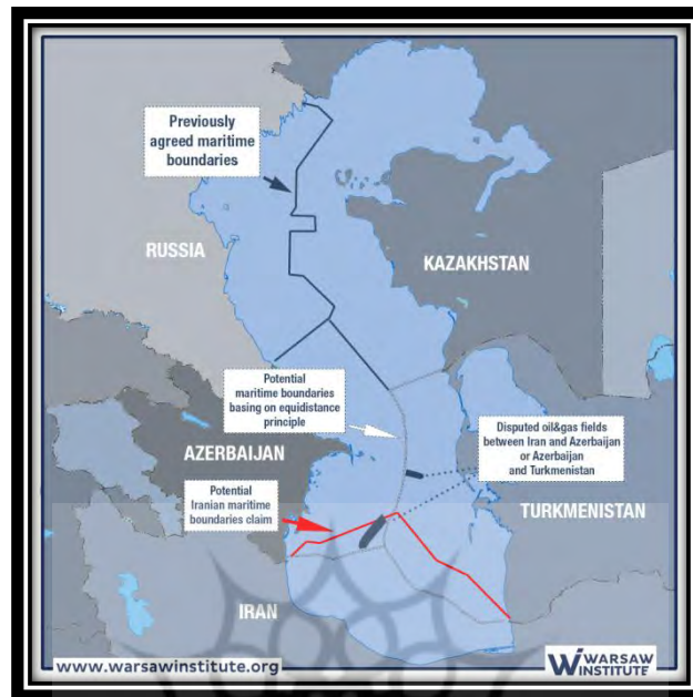
Map (3) Legal regime of the Caspian Sea after the collapse of the Soviet Union

رژیم حقوقی دریای خزر پس از فروپاشی اتحاد جماهیر شوروی