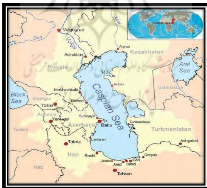
Map (1) Range of Caspian Sea Countries

دریای خزر (کاسپین)، بزرگترین دریاچه جهان در مرز بین آسیا و اروپا، در شمال ایران و در محل تلاقی آسیای مرکزی، قفقاز و ایران واقع شده است و سواحل غربی آن، حد شرقی قفقاز را تشکیل می‌دهد. طول دریای خزر از شمال به جنوب ۱۲۰۴ کیلومتر، عرض متوسط آن ۳۲۰ کیلومتر و طول خط ساحلی آن ۶۵۰۰ کیلومتر است. از این مقدار ۶۵۷ کیلومتر ساحل ایران، ۸۲۰ کیلومتر ساحل جمهوری آذربایجان، ۱۹۰۰ کیلومتر ساحل قزاقستان، ۱۷۶۸ کیلومتر مربوط به ترکمنستان و ۱۳۵۵ کیلومتر بقیه ساحل روسیه است (Amirahmadian, 2001:141-142).