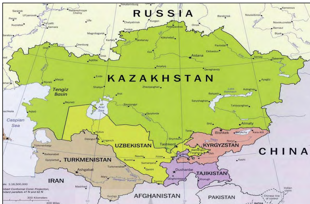
نقشه شماره ۲: کشورهای منطقه آسیای میانه