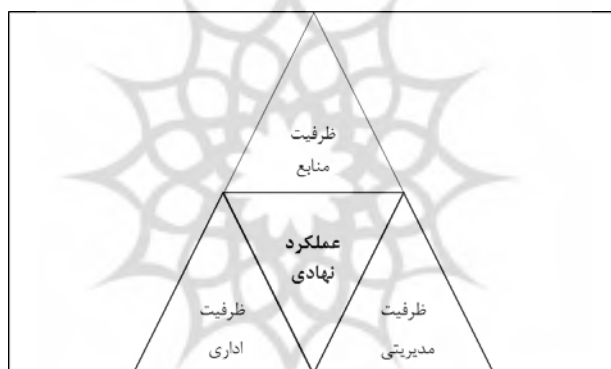
شکل ۱: ابعاد ظرفیت برای عملکرد نهادی

و بافت‌های تاریخی و قدیمی شهر با معماری سنتی و چشم‌نوازشان یکی از عناصر گردشگری شهری محسوب می‌شوند. نهادهای محلی به خصوص نهادهایی که در زمینه گردشگری و محیط‌زیست فعال هستند می‌توانند سرمایه‌گذاران را به سوی سرمایه‌گذاری در محورهای تاریخی شهر سوق دهند. بافت‌های تاریخی کانون و هسته شهرها هستند. حیات این بافت‌ها طی سده‌های گذشته پایه بسیاری از آداب و رسوم و حتی فرهنگ موجود و نیز رونق اقتصادی شهر و منطقه بوده است. فضاهای تاریخی شهری قبل از همه وظیفه دارند تاریخ، هویت عینی و ذهنی شهر را حفظ کنند و در زندگی جاری سازند. پاسدار همه خاطرها و یادمان‌ها بوده و از این رو باید فعالیت‌هایی را در کالبد خود جای دهند که با هدف یاد شده انطباق یابد. چنین فضاهایی با توسعه فعالیت‌ها و فضاهای گردشگری در حفظ بناها و عناصر تاریخی خود موفق می‌شوند و حضور شب و روز شهروندان و گردشگران را امکان‌پذیر می‌سازند. نهادهای محلی می‌توانند از این ظرفیت خود استفاده نمایند و با جلب و حضور مشارکتی مردم، جوانان و نوجوانان در جشن‌ها، انواع گردهمایی‌های اجتماعی، برپایی نمایش‌ها اشکال گوناگون تعاملات اجتماعی و فرهنگی و هر آن چه که مظهر تنوع فرهنگی و قومی یک ملت بزرگ با تاریخ هزاران ساله است را معرفی نمایند (Kalantari va hamkaran, ۱۳۹۴: ۱۰).