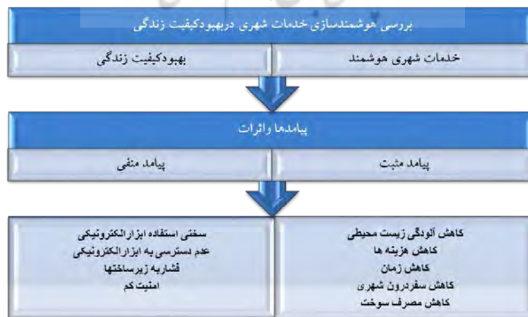
شکل ۱: الگو و مدل مفهومی پژوهش / research Findings/ 2015

بنابراین مزایای استفاده از خدمات شهری هوشمند در بهبود کیفیت زندگی شهری بسیار فراوان می‌باشد. که در این زمینه یکسری پیامدهای مثبت ومنفی را نیز شامل می‌گردد که در ادامه بررسی می‌گردد. همچنین در این زمینه الگو و فرایند مفهومی پژوهش به شرح ذیل می‌باشد: