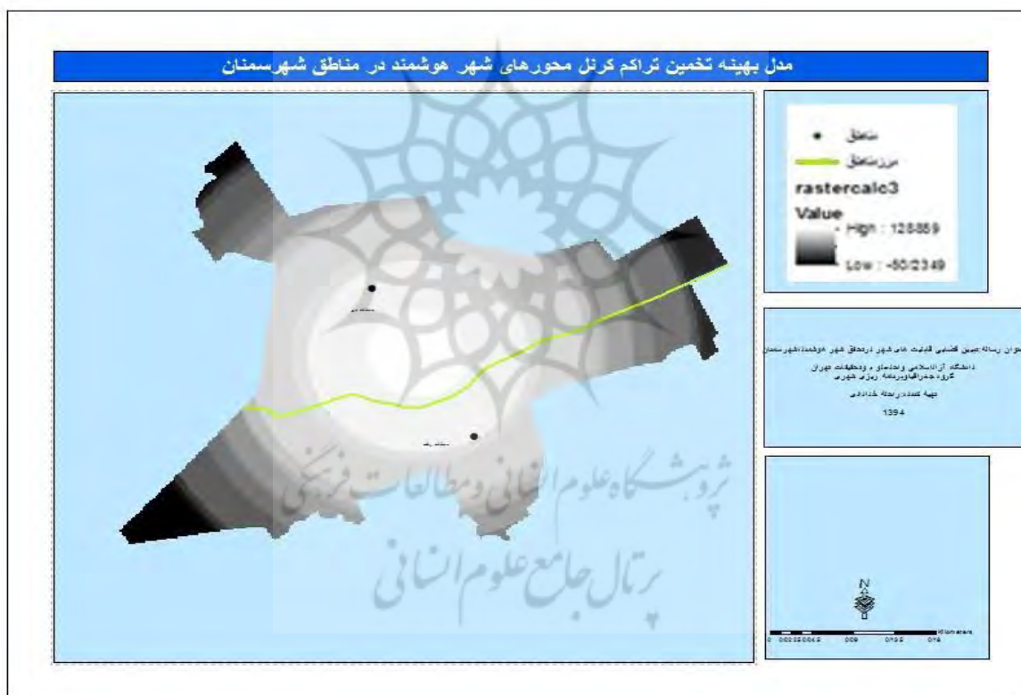
شکل ۳: نقشه مدل بهینه تراکم کرنل محورهای شهر هوشمند

با توجه به نقشه مذکور همانطور که ملاحظه می‌گردد رنگ روشن نشان از تراکم زیاد و هرچه رنگ تیره تر می‌شود تراکم کمتر را نشان می‌دهد. تراکم معیارها در منطقه دو شهرداری سمنان بیشتر است زیرا این منطقه بافت جدید و نوساز شهری را دربردارد که بیشتر معیارها در آن به وفور یافت می‌گردند. و اما تراکم کمتر معیارها در منطقه یک به دلیل بافت قدیم و کمبود امکانات در منطقه مذکور است.