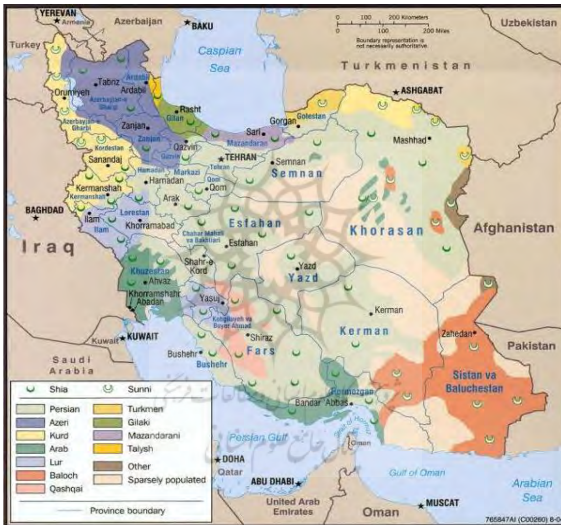
نقشه شماره ۳: جغرافیای مذهبی اقوام در ایران

مناطق کردنشین عمدتاً کوهستانی است که از شرق به وسیله دامنه‌های شرقی کوه‌های زاگرس و دریاچه ارومیه منتهی می‌شود. از این قسمت به طرف جنوب و حد فاصل همدان و سنندج امتداد می‌یابد. در طرف جنوب هم بعد از دورزدن کرمانشاه و کرکوک به موصل ختم می‌شود. از شمال به طرف ماردین، ویران‌شهر و اورفه امتداد یافته، آن‌گاه از شمال به طرف ملطیه و حوزه رود فرات می‌رود تا به کمالیه می‌رسد. در قسمت‌های شمالی کردستان محدود به کوهستانهای مرگان داغ و هارال داغ است که به طرف ارزنجان و ارزروم امتداد یافته و تا کوه‌های آرارات پیشرفته که مرز طبیعی بین ترک‌ها در شمال و کردها در جنوب به شمار می‌رود (fa.wikipedia.org).