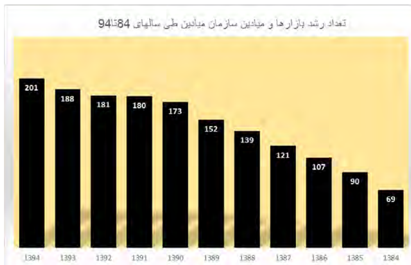
نمودار شماره ۱: روند رشد و توسعه سازمان میادین شهرداری تهران