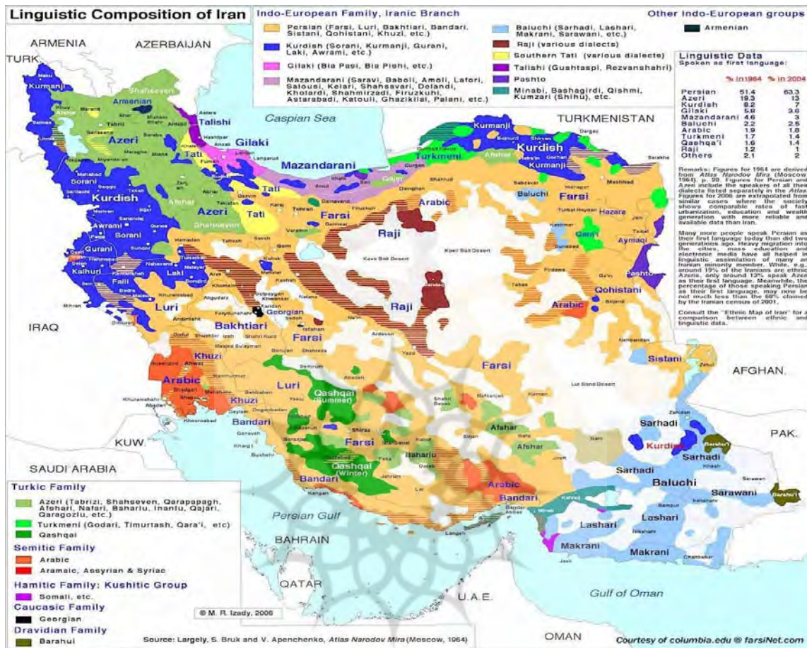
نقشه شماره ۱: جغرافیای اقوام در ایران

حال توسعه به ویژه خاورمیانه، فصل مهمی از تاریخ درگیری‌های این ملت‌ها را نشان می‌دهد و عملاً به مسأله ای امنیتی تبدیل گردیده و در بسیاری موارد تمامیت ارضی واحدهای مختلف سیاسی را تهدید می‌نماید و در این میان کشور ما نیز با توجه به تنوع اقوام از این امر مستثنی نمی‌باشد (Nasri Meshkini, 2008: 158-159).