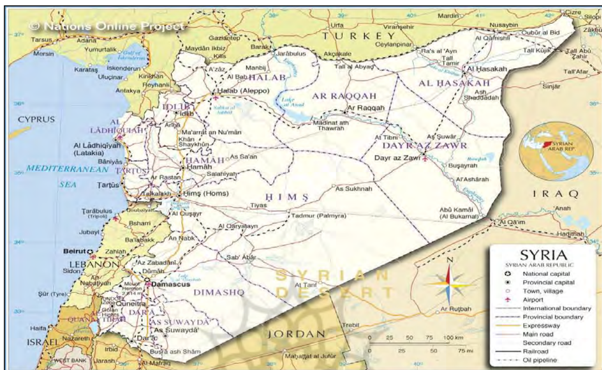
نقشه شماره ۲- کشور سوریه

برقراری توازن بین محورها و تضعیف مقاومت اسلامی و مهار ایران را دنبال نمی‌کند (Humud and et al.1998:p15-). (32)