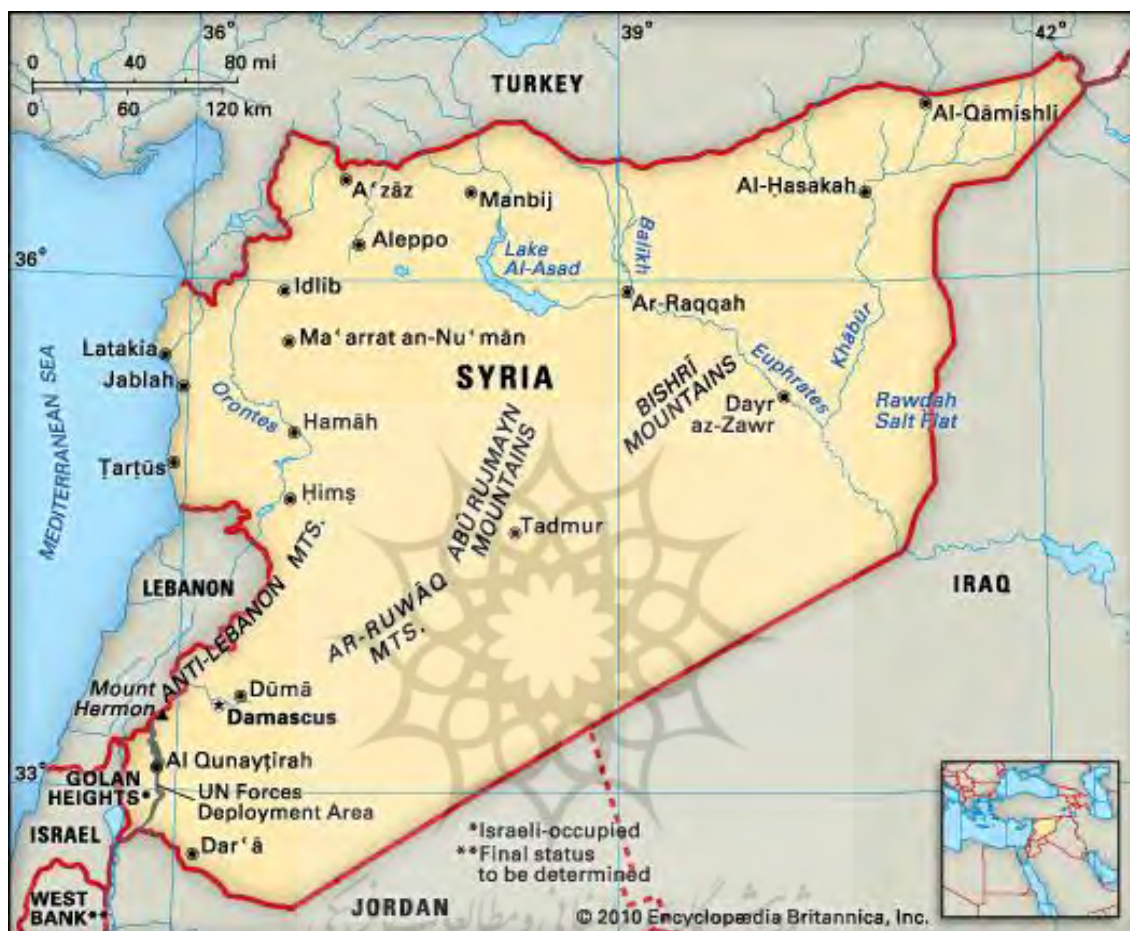
نقشه شماره ۱- ژئوپلیتیک سوریه

ژئوپلیتیک سوریه ۱ به شکلی است که جایگاه راهبردی به این کشور بخشیده است؛ قرار گرفتن این کشور در نقطه اتصال سه قاره آسیا، اروپا و آفریقا باعث شده این کشور به عنوان یک بازیگر میان اروپای صنعتی و خاورمیانه ۲ به ایفای نقش بپردازد (Ajourloo, 2011: 56).