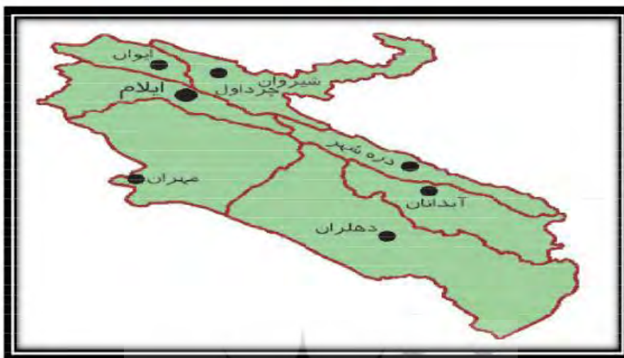
نقشه شماره ۱: موقعیت جغرافیایی منطقه مورد مطالعه

کوهستانی قرار دارد. شهر ایلام از شمال، شمال شرقی و شرق به ارتفاعات معروف به (سلم)، کوه مانشت و کوه‌های «انار» و کاوراه محدود شده است. بلندترین قله کوه اطراف شهر ایلام کاوراه با ارتفاع ۲۰۰۰ متر قرار دارد که در جنوب شرقی ایلام با شیب کمی به زمین‌های زراعی مسدود می‌گردد. (شوهانی، ۱۳۷۹، ص ۴۴).