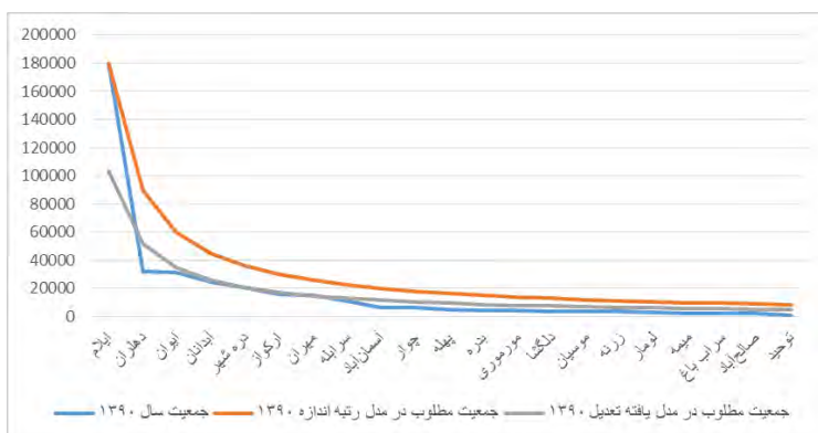
نمودار شماره ۲: جمعیت شهری و درصد جمعیت براساس قانون رتبه اندازه و مدل تعدیل یافته ۱۳۹۰