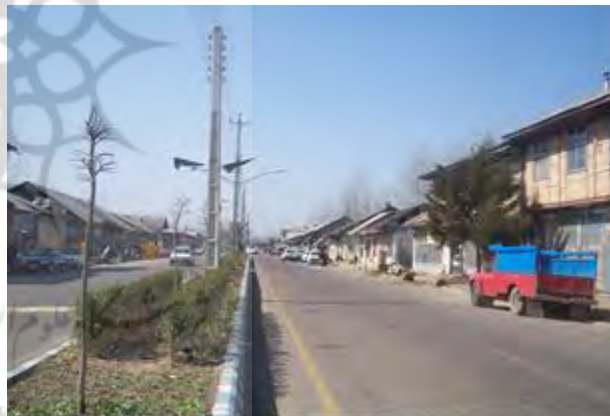
شکل شماره ۳: شکل‌گیری بافت تجاری و معابر عمومی شهر رودبند