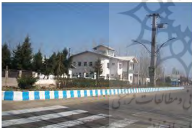
شکل شماره ۴: شکل‌گیری بافت اداری و معابر عمومی شهر رودبند