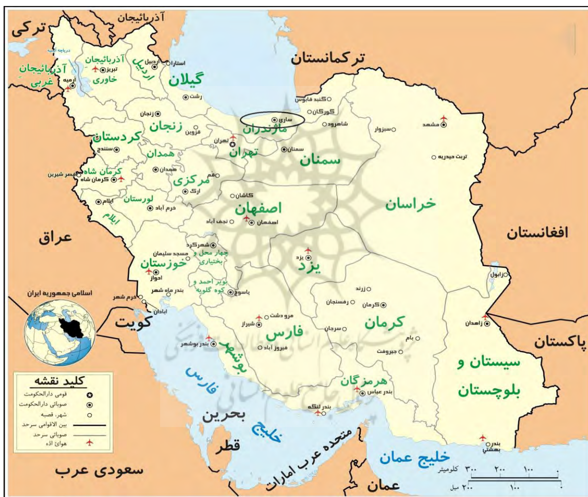
نقشه شماره ۱- موقعیت شهر ساری در ایران

شهر ساری در بخش شمالی شهرستان ساری قرار گرفته است. شهرستان ساری در استان مازندران و در ۳۶ درجه و ۴ دقیقه تا ۳۶ درجه و ۴۷ دقیقه عرض شمالی و ۵۳ درجه و ۲ دقیقه تا ۵۳ درجه و ۲۷ دقیقه طول شرقی واقع شده است و مساحت آن ۳/۲۴۸/۴۰۰ متر مربع است. از شمال و شمال شرقی به دریای مازندران و شهرستان بهشهر، از جنوب و جنوب شرقی به رشته‌کوه‌های البرز و استان سمنان، از مشرق به شهرستان میان‌دورود و از مغرب به شهرستان‌های قائم‌شهر، سوادکوه و جویبار محدود است. با توجه به آخرین آمار و اطلاعات جمعیتی به دست آمده، شهر ساری در سال ۱۳۹۰ جمعیتی حدود ۲۹۹۵۲۶ نفر داشته است. در شکل شماره یک موقعیت شهر ساری در کشور نشان داده شده است.