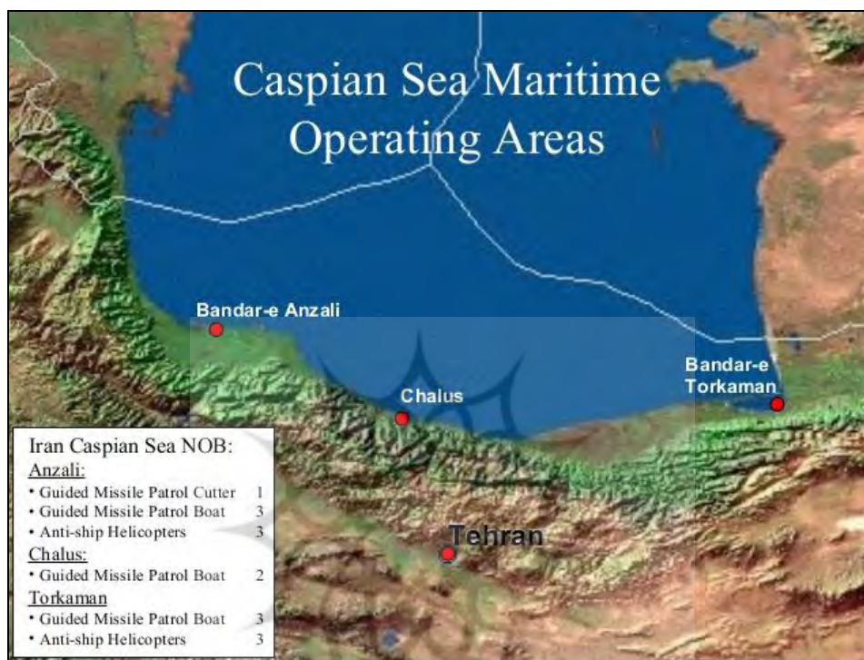
نقشه شماره ۲- مهم‌ترین بنادر فعال دریای خزر در سواحل ایران

سال‌های اخیر به دنبال استقلال جمهوری‌های حاشیه دریای خزر، موقعیت سیاسی و اقتصادی دریای خزر دگرگون گشت و در این میان ایران به‌عنوان نزدیک‌ترین راه ارتباطی این کشورها به دریای آزاد و قرار داشتن در مسیر کریدور شماره ۹ (شمال- جنوب) از اهمیت خاصی برخوردار گردید. حمل و نقل و جابجایی کالاها از طریق بنادر دریای خزر به اروپا در مقایسه با مسیر خلیج فارس به علت شرایط مساعد آب و هوایی، ارزانی نرخ حمل و نقل و کوتاه بودن مسیر کشتیرانی بسیار مناسب‌تر و مقرون به صرفه است.