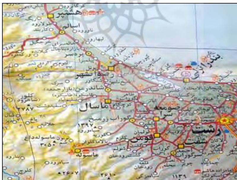
نقشه شماره ۴- طبیعت مازندران

از لحاظ طبیعی مازندران به سه قسمت اصلی کوهستانی در جنوب، میان بند در وسط و جلگه‌ای در شمال تقسیم می‌شود. شیب ناهمواری‌های آن از غرب به شرق به موازات دریای خزر است. رشته کوه البرز با رودهای کوچک و بزرگی که در امتداد شمالی - جنوبی آن جریان دارند به سه منطقه غربی، مرکزی و شرقی تقسیم شده است. بر اساس سرشماری سال ۱۳۹۰، جمعیت استان مازندران بالغ بر ۳۰۷۳۹۴۳ نفر است کل جمعیت نقاط شهری برابر ۱۶۸۲۱۵۲ و کل جمعیت نقاط روستایی برابر ۱۳۹۱۷۸۶ نفر است. اهالی مازندران به زبان‌های فارسی و گویش مازندرانی تکلم می‌کنند. گویش مازندرانی که بازمانده زبان ایرانیان قدیم (پارسی میانه) است تقریباً در همه جای استان متداول است. در این استان ۹۹/۷ درصد جمعیت آن را مسلمانان شیعه تشکیل می‌دهند.