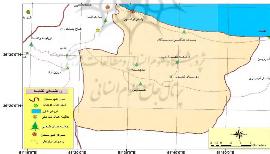
نقشه شماره ۵: شهرستان نوشهر

نوشهر در طول جغرافیایی ۵۱۳۰ درجه شمالی و ۳۶۳۹ درجه شرقی قرار دارد. شهرستان نوشهر از شمال به دریای خزر، از جنوب به رشته‌کوه‌های البرز، از شرق به شهرستان نور و از غرب به شهرستان چالوس متصل است. ارتفاع آن از سطح دریا ۲۹- متر است. نوشهر دارای دو بخش مرکزی و کجور است.