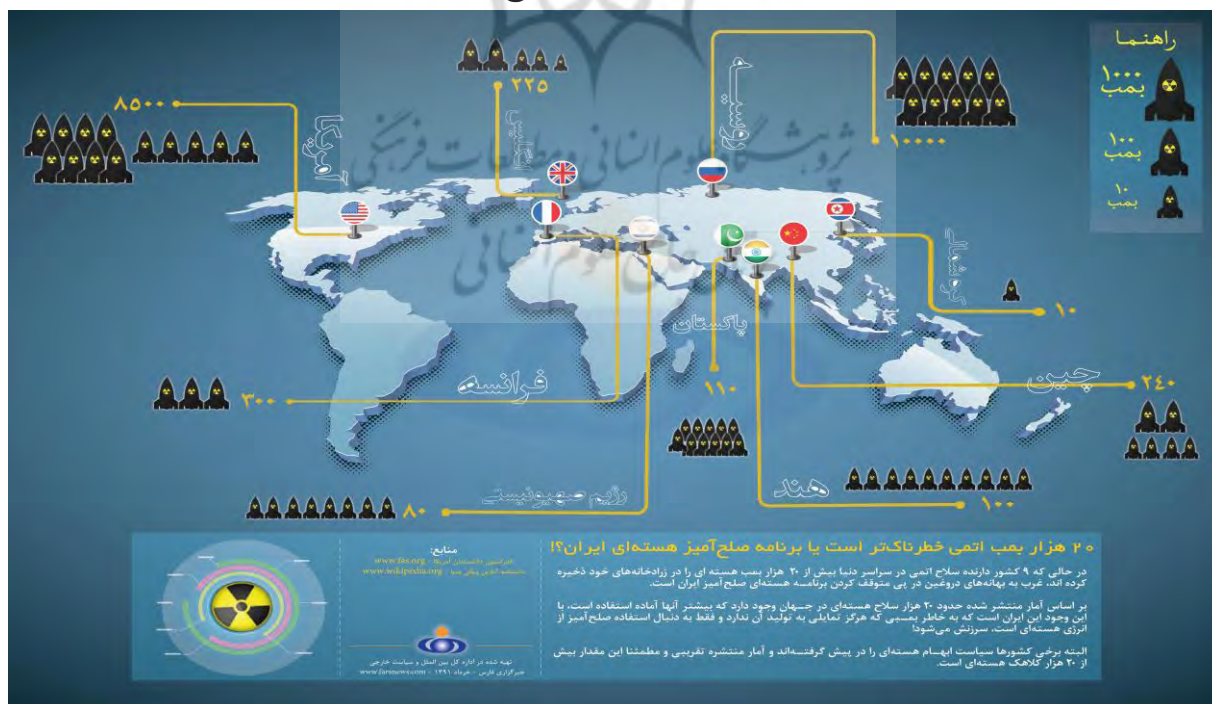
نقشه شماره ۲: نمایش امکانات تسلیحاتی (اتمی) کشورهای جهان

آنچه در زمینه نگرش امنیتی آمریکا و اروپا به ایران گفته شد، آشکارا بیانگر شکل‌گیری ذهنیت غرب نسبت به ایران بر مبنای انگاره‌ها و هنجارهایی است که در قالب دیدگاه سازه‌نگاری، منافع غرب را به‌طور عینی شکل می‌دهد و بر مبنای آنچه فکر می‌کند، رفتارها و مناسبات خود با ایران را معنا می‌کند. بر اساس آمار منتشر شده حدود ۲۰ هزار سلاح هسته‌ای در جهان وجود دارد که بیشتر آن‌ها آماده استفاده است، با این وجود این ایران است که به خاطر بمبی که هرگز تمایلی به تولید آن ندارد و فقط به دنبال استفاده صلح‌آمیز از انرژی هسته‌ای است، سرزنش می‌شود