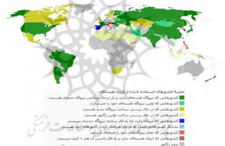
نقشه شماره ۱: کشورهای استفاده‌کننده از انرژی هسته‌ای

در نقشه شماره ۱ کشورهای استفاده‌کننده از انرژی هسته‌ای نمایش داده شده است: