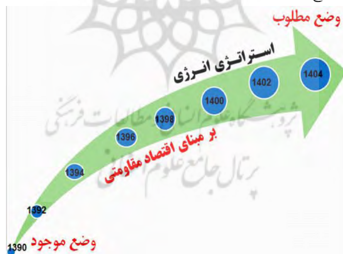
شکل شماره ۱: استراتژی انرژی بر مبنای اقتصاد مقاومتی

در شکل زیر جهت هدایت وضع موجود به وضعیت مطلوب نمایش داده شده است: