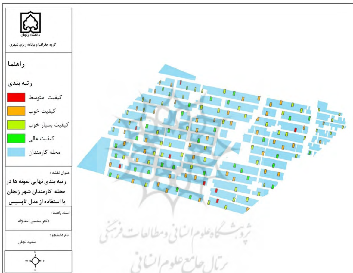
نقشه ۲: رتبه بندی شاخص‌های کیفیت زندگی محله کارمندان شهر زنجان براساس مدل Topsis