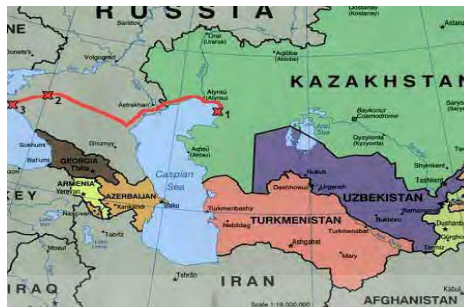
نقشه شماره ۱: کشورهای حوزه خزر

جمله عهدنامه «مودت» و دوستی بر اساس این قرارداد هر دو دولت بالسویه حق کشتیرانی آزاد در زیر بیرق‌های خود در بحر خزر پیدا کردند. در ضمن در ۱۹۲۷ موافقت‌نامه‌ای میان دو کشور ساحلی در رابطه با ماهی‌گیری در دریای مازندران بسته شد و اعلام شد که این دریا بین ایران و روسیه است و به روی کشورهای ثالث بسته خواهد شد. در ۱۹۴۰ اصل برابری حاکمیت و تساوی حقوق دو کشور تأکید شد و دریای مازندران به دریای ایران و شوروی نام برده شد. فروپاشی اتحاد جماهیر شوروی تحولات گسترده‌ای را در سطوح جهانی و منطقه‌ای در پی داشت.