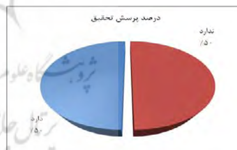
نمودار شماره ۲: وجود پرسش در تحقیق