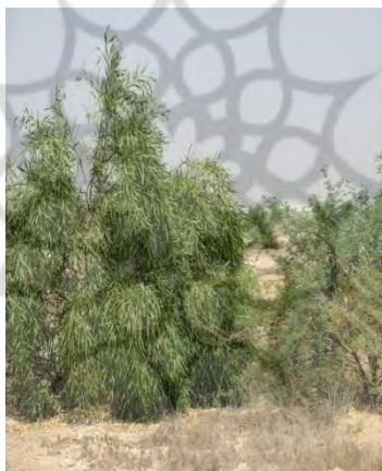
شکل ۳- ایجاد افزایش تنوع گونه‌ای با استفاده از گونه افاقیا افرا ۱ در عرصه‌های بیابانی ماهشهر شهریور ۱۳۸۶