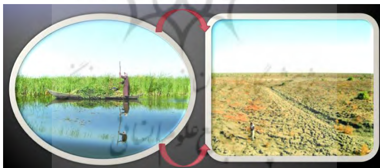
شکل ۳- تغییر چشم انداز تالاب هورالعظیم

در واقع بین‌النهرین به وسیله سرشاخه‌هایی تغذیه می‌شود که از کشورهای ترکیه، سوریه و ایران سرچشمه می‌گیرند و بیشترین آب آن از کوه‌های ترکیه می‌آید که توسعه شتابناک این کشور و ساخت سدهای متعدد از عواملی است که به ایجاد این سامانه کمک کرده است. استراتژی‌های اخیر کشور ما نیز بر این است که آب‌های مرزی که از کشور خارج می‌شوند مهار شود و همین مسأله موجب خشک شدن پایاب این رودخانه‌ها و تغییر چشم انداز تالاب‌های جنوب عراق شده است (به شکل ۳- توجه شود).