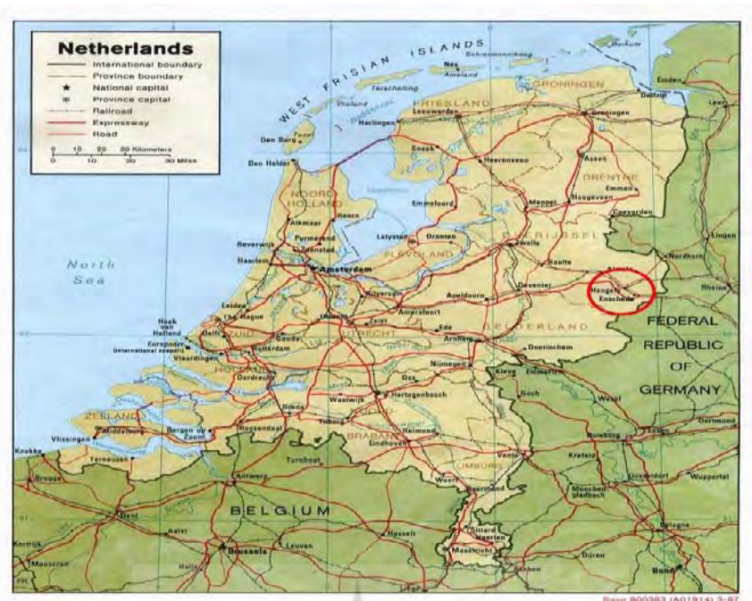
نقشه شماره ۵- منطقه مرزی ائشد-گرونا میان هلند و آلمان

مطالعه درباره مرزها و مناطق مرزی حاکی از نفوذ سیاسی محلی به عنوان بعد مهمی از پژوهش‌های جاری درباره پدیده «مرز» می‌باشد. این فاکتور امکان ایجاد تمایز میان مرزهای دقیق و ترسیم شده که یا باعث وحدت و یا تفکیک انسانهایی با هویت‌ها و مشروعیت‌های چندگانه می‌شود، و مرزهایی که میان اجتماعات ملی شکاف ایجاد می‌نماید را میسر می‌سازد. نفوذ سیاسی و فرهنگ محلی چشم‌اندازهای مهمی در فرایند تحلیل مرزها به شمار می‌آیند. مثلاً سیاست‌هایی که محدوده فرهنگی یا ارضی را ترسیم می‌کنند، سیاست‌های امنیت مرزی یا سیاست‌هایی که میان خط مشی‌های مطلوب و نامطلوب، همچون قاچاق یا مهاجرت تمایز قائل می‌شود، همه این موارد چالش‌هایی را پیش روی می‌نهند که با سطح همگرایی فرهنگی محلی و قدرت سیاسی تناسب دارد. ادبیات جاری درباره سیاست‌گذاری راجع به مرزها بر این است که این سیاست‌ها اغلب ناموفق و ناکارآمد می‌باشند.