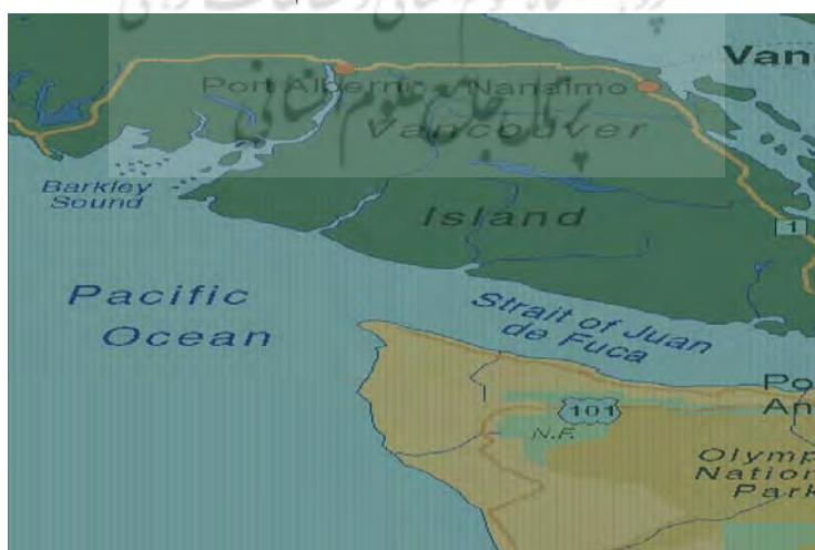
نقشه شماره ۴- مرز آمریکا و کانادا در منطقه سیاتل - ونکوور