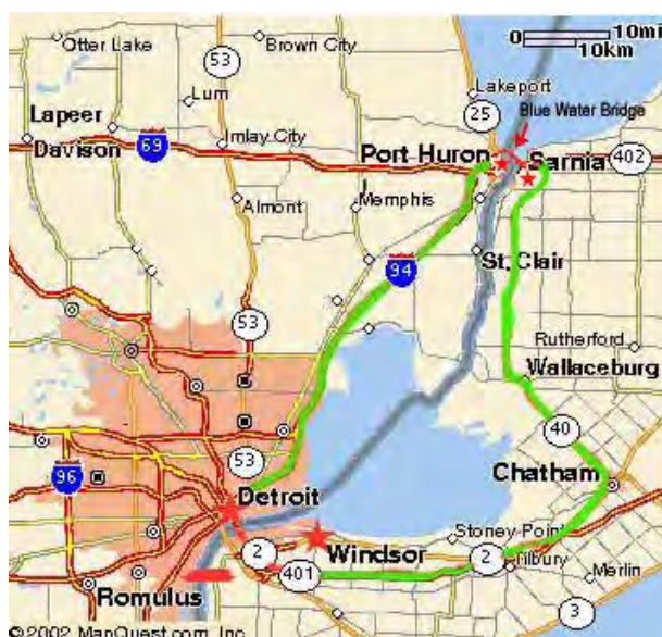
نقشه شماره ۶- مرز دیترویت - ویندسور میان آمریکا و کانادا

از طرف دیگر در دوره کنونی که امنیت به پدیده فراگیری تبدیل شده است، به نظر می‌رسد که نظریه جهان بدون مرز که توسط اوهمای مطرح گردیده و مبتنی بر حمایت از جهانی شدن و همگرایی اقتصادی است، زیر سوال رفته است. از این روی، مطالعه پدیده‌هایی چون مرزها، قلمروها و مناطق مرزی به توضیحات بیشتر از آنچه که امروزه بر اقتصاد نیروهای بازار، فعالیت حکومت‌ها و نقش فرهنگ و اجتماعات محلی در تبیین شفاف مرزها متمرکز است، احتیاج دارد. باید گفت تمامی مطالعاتی که تاکنون در تبیین پدیده مرز صورت گرفته به نوعی به اندیشمندان این حوزه کمک می‌نمایند، اما آنچه از منظر این مطالعات دور مانده است، همپیوندی یا رابطه درونی یا مجموعه‌ای از دلایلی است که بتواند راهگشای مدل یا نظریه‌ای درباره مرزها باشد. به عنوان مثال، همانگونه که از مطالب برگرفته مستفاد می‌گردد، جغرافیدانان و مورخان به نقش بازیگران محلی و اجتماعات پرداخته‌اند. اندیشمندان علوم سیاسی سازوکارهای نهادساز را مهم بر می‌شمارند و اقتصاددانان نیز ضمن مخالفت با سایر رشته‌های علوم اجتماعی، به نقش محدود کننده مرزها در جریان کالاها و انسانها می‌پردازند.