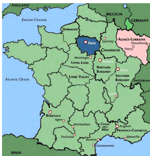
نقشه شماره ۱- منطقه مرزی آلس در فرانسه

آثاری از این دست توسط جغرافیدانان یا مورخین، به شکل‌گیری نظم سیاسی مدرن، که مستلزم عمل شناسایی ۱ بین‌المللی توسط سایر دولت‌ها از مرزهای دولتهای دارای حق حاکمیت و همچنین مرزهای سرزمینی شناخته شده بودند، کمک نمود. در نظام بین‌الملل معاصر که بر برتری و تفوق حاکمیت‌های کشوری پایه‌گذاری شده است، شناسایی، خصوصیت یک تاسیس (نهاد) را دارا می‌باشد. به عبارت دیگر، هنگامی که کشوری جدید در صحنه بین‌الملل ظاهر می‌گردد، یعنی عوامل تشکیل دهنده آن جمع گردیده است، سایر کشورها به منظور برقراری ارتباط با آن کشور، باید آن را به رسمیت بشناسند و موجودیتش را تایید نمایند (ضیایی بیگدلی، ۱۳۸۳: ۱۸۹). مثال بارز در این زمینه پیمان اسپانیایی - آلمانی وستفاليا است که در سال ۱۶۴۸ میلادی منعقد گردید. به موجب این پیمان مرزهای سرزمینی تحت مالکیت انگلستان، فرانسه، آلمان، شاهزاده نشین‌های آلمانی، مسکو، لهستان، ترکیه، اسپانیا و سوئد مشخص و ترسیم گردیدند. این پیمان آغازگر دوران دولت - ملت و ملی‌گرایی در جهان مدرن گردید، دورانی که مورخین و جغرافیدانان متعددی در طول قرن نوزدهم و بیستم به تفصیل آن را مطالعه و تشریح نموده‌اند (نقشه شماره ۲).