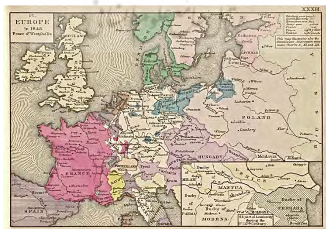
نقشه شماره ۲- مرز کشورهای اروپایی بعد از قرارداد وستفاليا

آثاری از این دست توسط جغرافیدانان یا مورخین، به شکل‌گیری نظم سیاسی مدرن، که مستلزم عمل شناسایی ۱ بین‌المللی توسط سایر دولت‌ها از مرزهای دولتهای دارای حق حاکمیت و همچنین مرزهای سرزمینی شناخته شده بودند، کمک نمود. در نظام بین‌الملل معاصر که بر برتری و تفوق حاکمیت‌های کشوری پایه‌گذاری شده است، شناسایی، خصوصیت یک تاسیس (نهاد) را دارا می‌باشد. به عبارت دیگر، هنگامی که کشوری جدید در صحنه بین‌الملل ظاهر می‌گردد، یعنی عوامل تشکیل دهنده آن جمع گردیده است، سایر کشورها به منظور برقراری ارتباط با آن کشور، باید آن را به رسمیت بشناسند و موجودیتش را تایید نمایند (ضیایی بیگدلی، ۱۳۸۳: ۱۸۹). مثال بارز در این زمینه پیمان اسپانیایی - آلمانی وستفاليا است که در سال ۱۶۴۸ میلادی منعقد گردید. به موجب این پیمان مرزهای سرزمینی تحت مالکیت انگلستان، فرانسه، آلمان، شاهزاده نشین‌های آلمانی، مسکو، لهستان، ترکیه، اسپانیا و سوئد مشخص و ترسیم گردیدند. این پیمان آغازگر دوران دولت - ملت و ملی‌گرایی در جهان مدرن گردید، دورانی که مورخین و جغرافیدانان متعددی در طول قرن نوزدهم و بیستم به تفصیل آن را مطالعه و تشریح نموده‌اند (نقشه شماره ۲).