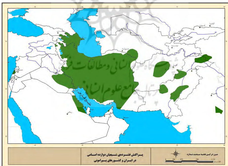
نقشه شماره ۱: پراکنش فشرده شیعیان دوازده امامی در ایران و کشورهای پیرامونی

یکی از مهم‌ترین عوامل گسترش تشیع در دوران عباسیان، مهاجرت سادات و علویان به این سرزمین، خصوصاً "بعد از ورود امام رضا (ع) است. همین مسئله زمینه خوبی برای جذب شیعیان و نشر تشیع فراهم آورد (همان: ۹). تشیع که از اوان پیدایش پدیده ای مذهبی، سیاسی بوده است تا دینی، توسط ایرانیان در سده نخست اسلامی پشتیبانی شد که با تکیه بر آن با دستگاه خلافت رویارویی کردند. در دوره صفوی هم با افزایش آن مردم را به پایداری در برابر عثمانی برانگیختند. تا این مقطع، شیعه کارکرد تاریخی خوبی داشته است، اما از دوره قاجار مناسبات سیاسی و اجتماعی و اقتصادی جهان دگرگون شد و شیعه نیز کارکرد شایسته خود را از دست داد. اما بعد از دهه هفتاد (۱۹۷۹م) وقوع انقلاب اسلامی در ایران و جنگ داخلی در لبنان، شیعه را به عنوان یک عامل ژئوپلیتیکی مطرح ساخت. بعد از حمله آمریکا به عراق نیز قدرت معنویت و نقش مذهب در حیات سیاسی منطقه خاورمیانه برای بار دوم نگاه‌ها را معطوف به مسأله تشیع نموده است.