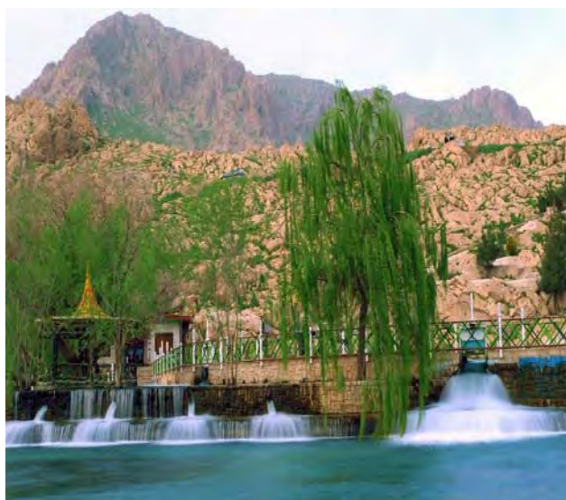
شکل شماره ۲: نمایی از سراب روانسر