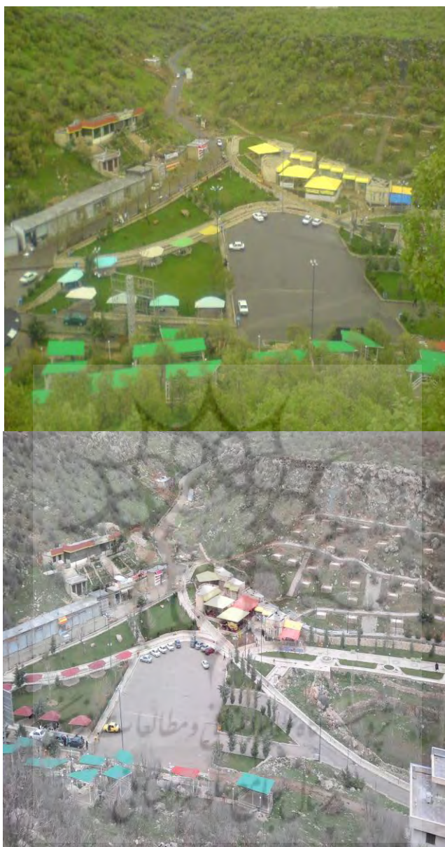
شکل شماره ۱: نماهایی از مجموعه تفریحی- گردشگری غار قوری قلعه در روستای قوری قلعه (شهرستان روانسر)

زیستگاه کوچک‌ترین گوزن جهان موسوم به شوکا ۱ یا به اصطلاح محلی فیله گیجه ۲ می‌باشد (ولدیگی، ۱۳۸۸: ۲۵)، موزه‌های مردم‌شناسی در شهرهای پاوه و جوانرود اشاره کرد.