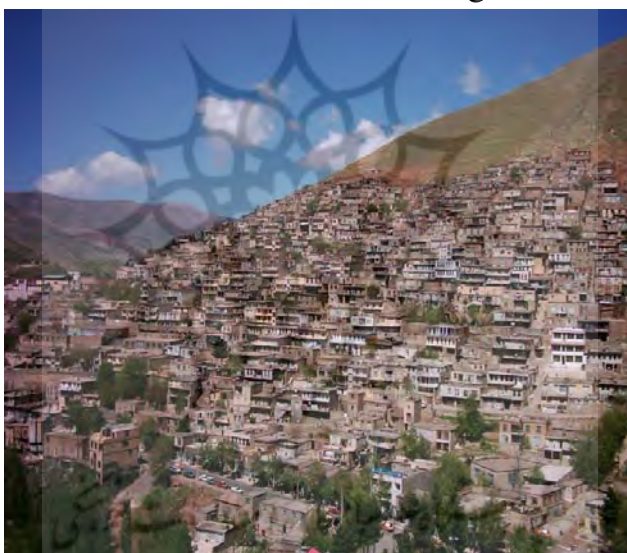
شکل شماره ۳: نمایی از شهر پاوه (معروف به شهر هزار ماسوله)