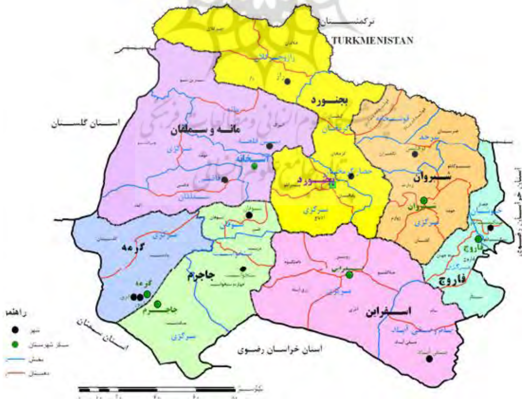
نقشه ۲- پراکنده‌گی شهرستان‌ها، شهرها، بخش‌ها و دهستان‌های استان ۱۳۹۰