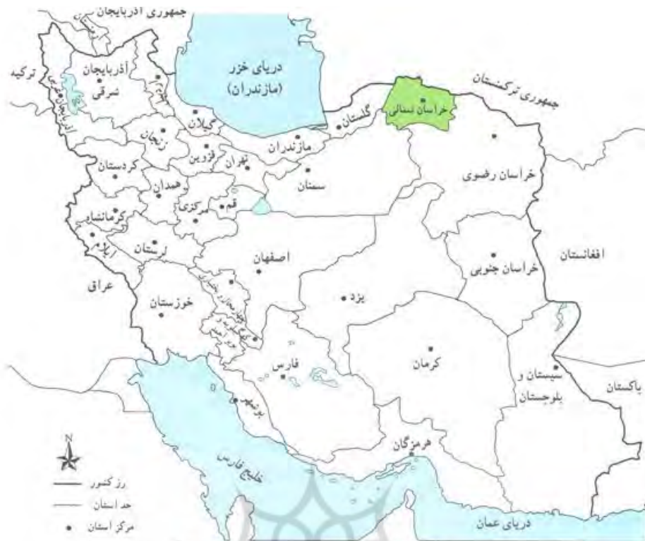
نقشه ۱- تقسیمات کشوری جمهوری اسلامی ایران به تفکیک استان