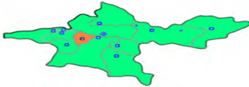
نقشه شماره (۳): شهر اسلام شهر