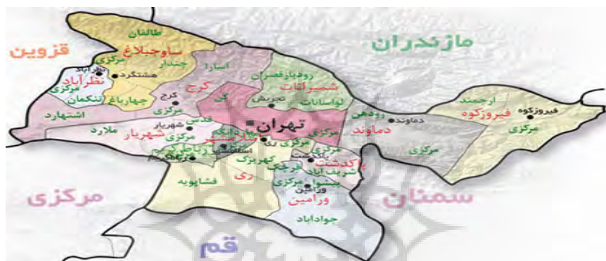
نقشه شماره (۱): شهرستان تهران

۱- موقعیت و وسعت: رباط کریم بین ۳۵ درجه و ۲۸ دقیقه عرض شمالی و طول شرقی آن از نصف النهار گرینویچ بین ۵۰ درجه و ۴۵ دقیقه غربی تا ۵۱ درجه شرقی قرار گرفته است. این منطقه با وسعتی حدود ۲۵۵ کیلومتر مربع در ارتفاع ۱۰۵۰ متری در جنوب غربی تهران واقع است و فاصله آن از تهران ۳۵ کیلومتر می‌باشد و در جنوب شهریار واقع است. حدود آن عبارت است از شمال به شهریار و از جنوب به اراضی فشاپویه و از شرق به زمین‌ها و محدوده اسلامشهر و از غرب به زرند محدود می‌شود.