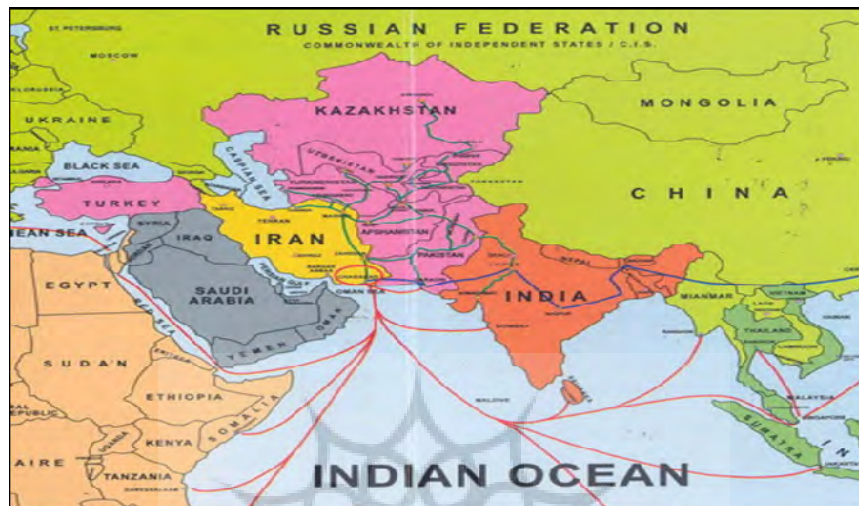
تصویر ۲: نمایش شماتیک موقعیت استراتژیکی استقرار منطقه چابهار به لحاظ دسترسی به نقاط مختلف جهان

از سوی دیگر، وجود «منطقه آزاد تجاری- صنعتی چابهار» در این محدوده، علاوه بر مزیت‌هایی که منطقه چابهار همیشه در امر تجارت و واردات و صادرات کشور ایران داشته و دارد، می‌تواند نقش ویژه‌ای را از نظر ورود و خروج کالاها و همچنین ترانزیت کالاها و مواد برای سایر کشورهای منطقه و اطراف ایفا نماید و میزان اهمیت این منطقه از کشور را دو چندان سازد.