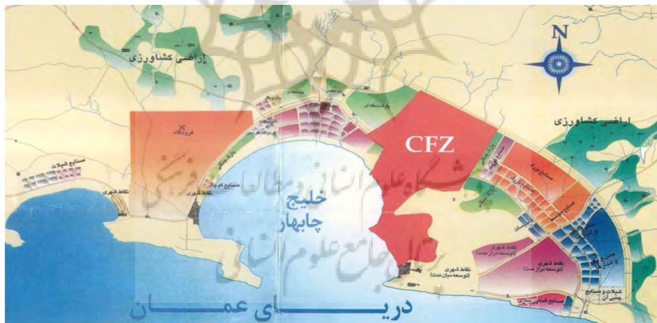
تصویر ۳: کاربری های اطراف منطقه آزاد تجاری- صنعتی چابهار

روستای مذکور در قسمت شمال غربی خلیج واقع و تنها سکونتگاه قبل از بندر کنارک است. در نقشه ذیل بعد کاربری های اطراف منطقه آزاد تجاری- صنعتی چابهار نمایش داده شده است.