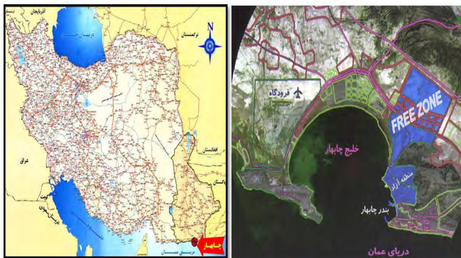
تصویر ۱: موقعیت منطقه آزاد چابهار در کشور ایران و خلیج چابهار