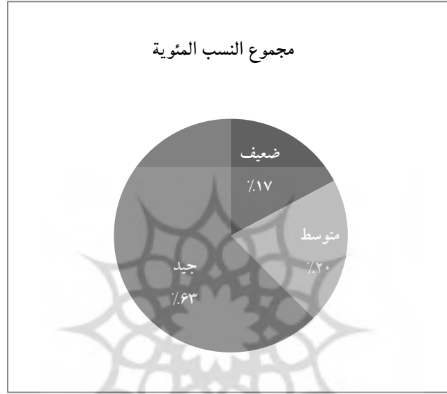
الرسم البياني (١-٢): مجموع نسب بنود التقويم

نلاحظ بشكل عام في الرسم البياني (١-٢) أن مجموع نسب بنود التقويم للمعايير قد أحرزت ٦١.٧٪ في المستوى الجيد و هي نسبة مناسبة فوق المتوسط، ونسبة ٢٠٪ في المتوسط، ونسبة ١٧٪ في مستوى الضعيف و هي أقل نسبة، مما يدل على نجاح هذه المجموعة في تحقيق معايير سمات الكتاب الجيد.