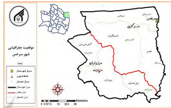
شکل ۲: موقعیت جغرافیایی شهر سرخس

درجه شمالی قرار گرفته است. حد طبیعی منطقه را در جنوب، رودخانه کشف رود و حد شرقی را تجن (از پیوستن رودخانه هریرود و کشف رود) و حدود طبیعی غربی و جنوب غربی را آخرین امتدادهای ارتفاعات کپه داغ مشخص می نماید.