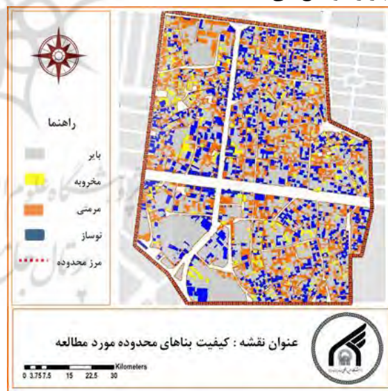
شکل ۵: کیفیت بنا در محدوده مورد مطالعه

در محدوده مورد مطالعه تعداد قابل توجهی از بناها یعنی حدود ۲۸ درصد آن ها مرمتی هستند و ۲۳ درصد از کل قطعات نیز نوساز می باشند و ۷ درصد بناها هم تخریبی هستند، قابل ذکر است که اراضی غیرقابل طبقه بندی هم شامل اراضی بایر و رها شده و مخروبه های موجود در محدوده می باشد که ۴۲ درصد را شامل شده و سهم شایان توجهی دارد ولی چنانچه بخواهیم در یک سهم بندی کلی کیفیت ابنیه موجود در محدوده مورد مطالعه را بسنجیم باید اذعان نماییم که همانا بیشتر وضعیت کالبدی ابنیه موجود، بلحاظ کیفی در دسته مرمتی و نیازمند به توجه بوده که این مهم نه تنها اهمیت پرداختن به این مقاله را تشدید نموده بلکه سهم بصری در رسیدن به توسعه پایدار شهری در این محدوده به نسبت کل شهر را توجیح می نماید.