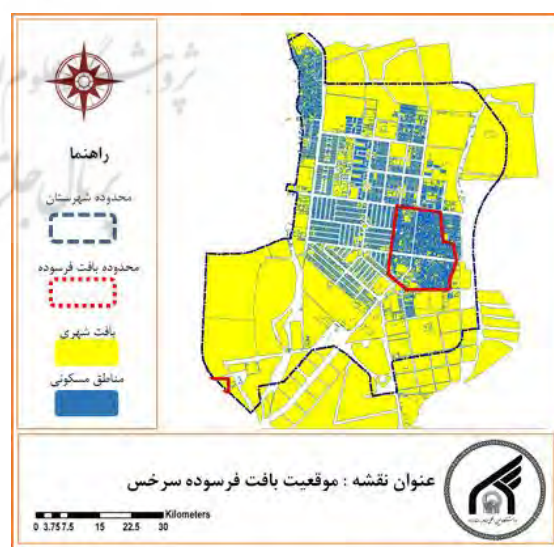
شکل ۳: بافت فرسوده شهرستان سرخس

شهر سرخس از لحاظ مورفولوژی داری دو بافت هندسی و ارگانیک می باشد قسمت ارگانیک شهر هسته اولیه شهر را تشکیل داده و مساحتی حدود ۷۷ هکتار را به خود اختصاص داده که حدود ۱۵ درصد از کل شهر می باشد. قسمت هایی از شهر که دارای بافت هندسی می باشند حدود ۶۴ درصد از کل شهر را به خود اختصاص داده اند. پهنه هایی از شهر نیز که دارای بافت ترکیبی می باشند بیش از ۱۵۰ هکتار را از آن خود کرده اند که ۲۱ درصد از بافت شهر را شامل می شود. محدوده مورد مطالعه به لحاظ منطقه ای در مرکز جغرافیایی شهر متمایل به سمت شرق قرار گرفته، که از لحاظ موقعیت ملکی در ردیف بهترین و متمایزترین املاک شهری است و از لحاظ بهره مندی از خدمات محیطی نظیر کاربری های تجاری، آموزشی و درمانی در بهترین منطقه موجود در شهر سرخس قرار دارد. این محدوده شامل بخش هایی از محله های ۱ و ۲ و ۹ و ۱۰ شهرداری است.