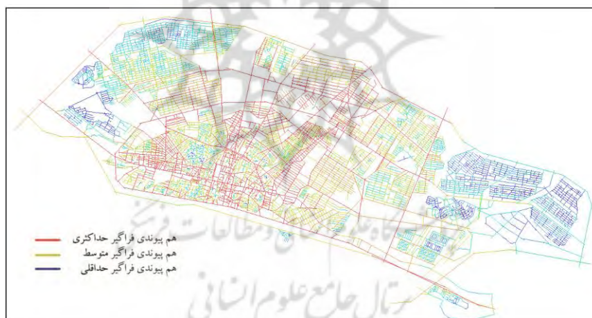
شکل شماره ۳. تعیین ضریب هم پیوندی فراگیر محدوده‌های آماده‌سازی در کل شهر با space syntax

در نهایت، تلفیق دولایه متغیر مستقل (عرضه زمین شهری) و متغیر وابسته (ساخت شهری) در قالب هم‌پوشانی وزنی نشان داد که سیاست‌های عرضه زمین رانتی در برخی نواحی شهری تأثیر قابل‌ملاحظه‌ای داشته است. و میزان تأثیرپذیری ساخت شهری به‌شدت وابسته به سیاست‌های عرضه زمین به‌ویژه شیوه مالکیت زمین و نحوه واگذاری آن از طریق شرکت‌های تعاونی با عضویت نهادهای دولتی و یا خصوصی است. طبق شکل ۵ و جدول ۵، محدوده گلشهر و پونک به‌شدت تحت تأثیر سیاست‌های نامطلوب و رانتی عرضه زمین بوده است. کوی گلشهر به‌عنوان تعاونی مسکن با عضویت غالب کارکنان دولت و پونک به‌عنوان اراضی دولتی تحت تملک سازمان مسکن و شهرسازی وقت در سال ۱۳۷۵ هم‌زمان و در قالب یک مصوبه علیرغم وجود زمین‌های خالی بسیار زیاد با کاربری مسکونی در داخل محدوده مصوب طرح جامع شهر زنجان، به محدوده شهر الحاق می‌شوند. این فرآیند منجر به تشدید ضریب هم پیوندی ضعیف و ناکارآمدی ساخت شهر زنجان گردید. این روند منجر به شکل‌گیری قطعات خالی زیاد در ساخت شهری زنجان گردید و