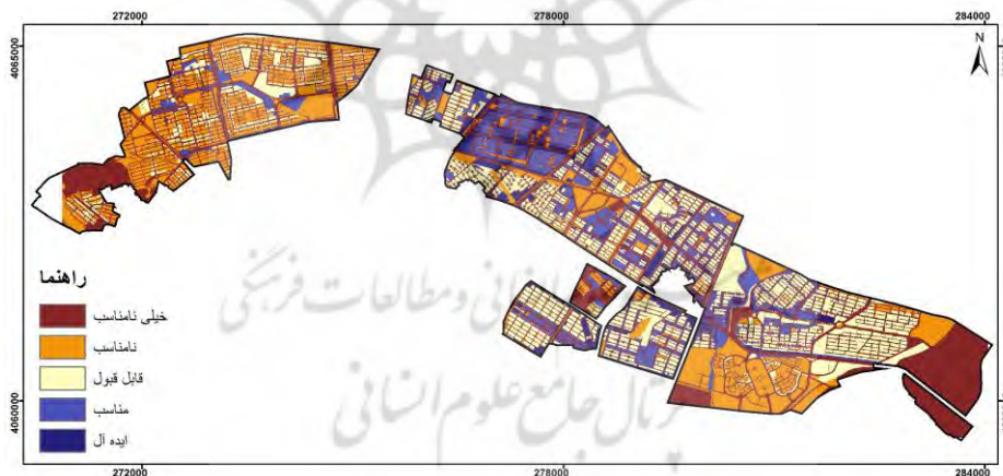
شکل شماره ۲. پهنه‌بندی محدوده بر اساس وضعیت شاخص‌های عرضه زمین

طبق بررسی‌ها، عناصر ساخت شهری در طرح‌های آماده‌سازی، تحت تأثیر عملکرد شرکت‌های تعاونی مسکن به‌ویژه از لحاظ جامعه هدف و تأثیر عضویت کارکنان دولت در آن‌ها قرار دارد. به‌طوری‌که ضریب هم‌پیوندی فراگیر در کوی کارمندان ۱/۳۲۷؛ زیباشهر ۱/۳۱۱؛ پایین کوه ۱/۳۱۲؛ شهریار ۱/۳۰۹؛ کوی ثبت ۱/۳۰۶ و کوی امید برابر ۱/۳۰۵ می‌باشد. این مقادیر نشانگر بالاترین پیوند و ارتباط با بخش قدیمی و مرکز شهر است. این محدوده‌ها غالباً با خطوط محوری قرمز رنگ مشخص شده است. درحالی‌که سایر محدوده‌ها، به‌ویژه فرهنگیان با ضریب ۱/۲۱۲؛ کوی صدرا با ضریب ۱/۲۱۵؛ نانوایان با ضریب ۱/۲۱۵؛ اندیشه ۲ با ضریب ۱/۲۱۶؛ گلشهر با ضریب ۱/۲۲۵؛ و پونک با ضریب ۱/۲۲۹ که تحت مالکیت شرکت‌های تعاونی مسکن با عضویت کارکنان دولتی هستند، پایین‌ترین سطح ضریب هم‌پیوندی را دارند. علاوه بر این، کوی‌هایی که دارای ضریب هم‌پیوندی بالایی هستند، میزان ساخت ۵۰ درصد کل قطعات