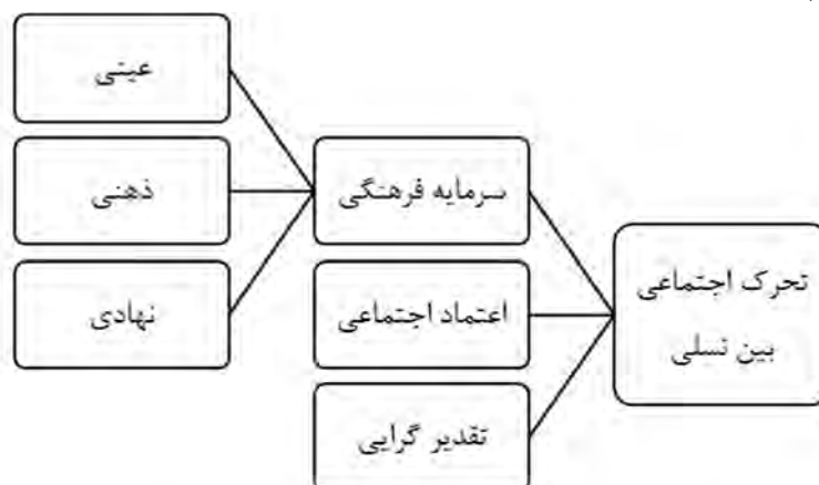
شکل ۱- مدل نظری تحقیق

ابزار پژوهش از آزمون آلفای کرونباخ استفاده شد. میزان آلفای محاسبه شده کلی به مقدار 0/781 و شاخص های تقدیرگرایی با ضریب 0/806 ، سرمایه اجتماعی 0/808 و اعتماد اجتماعی 0/712 محاسبه گردید که نمایانگر مطلوبیت پایایی پرسش نامه می باشد.