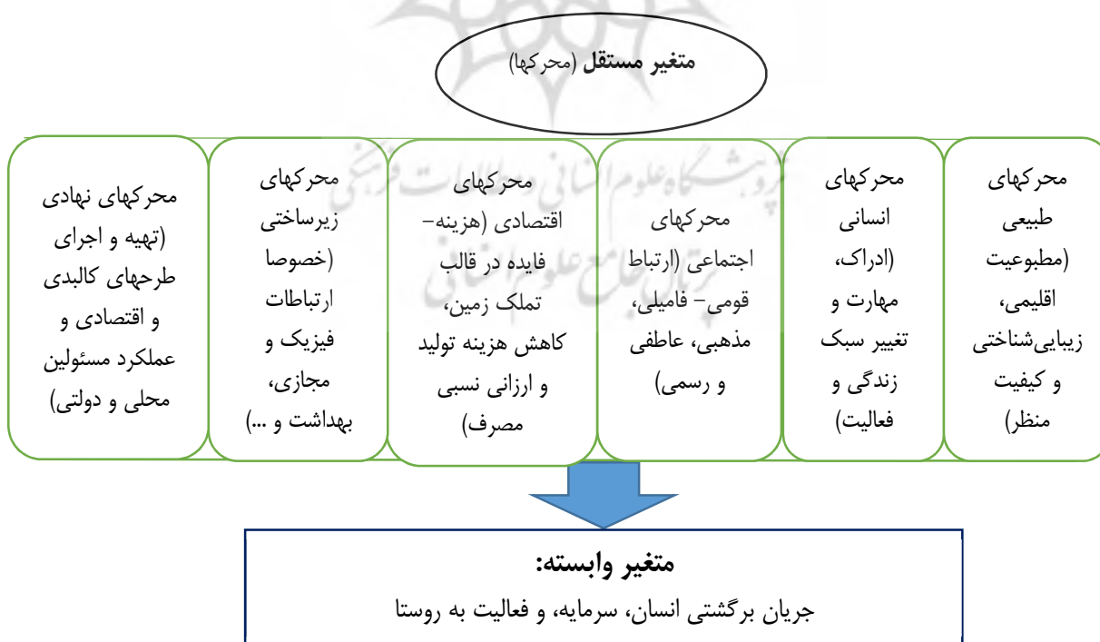
شکل ۲- مدل مفهومی نشانگر ارتباط بین متغیرهای مستقل و وابسته (ترسیم: نگارندگان)