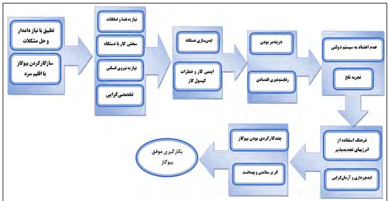
شکل ۲. فرآیند بیکارگیری موفق فناوری بیوگاز در بین دامداران سنتی ایران