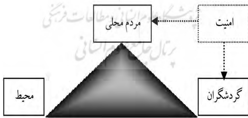
شکل ۱. مثلث پایداری گردشگری با تأکید بر امنیت (manoochehri & manoochehri, 2014: 107)

سفر نمی‌کنند. امروزه بحث امنیت مهم‌ترین و زیربنایی‌ترین اصل در تدوین راهبردهای توسعه گردشگری است. میان گردشگری، ثبات، توسعه و امنیت ارتباطی متقابل وجود دارد (seydai & hedayati, 2010: 102). امنیت عامل اصلی برای جلب گردشگران در روستاها است و چنانچه امنیت برقرار باشد و گردشگران احساس امنیت داشته باشند رونق گردشگری، توسعه روستایی را به همراه خواهد داشت این امر از آنجایی حائز اهمیت است که توسعه نیز تأمین‌کننده امنیت خواهد بود (manoochehri & manoochehri, 2014: 104)؛ بنابراین می‌توان گفت که گردشگری و امنیت در مقوله، وابسته به یکدیگر و در تعامل دوجانبه باهم هستند، به طوری که هم می‌توانند تأثیر افزایشی و هم تأثیر کاهشی بر هم داشته باشند به طوری که هرگاه در سطح مکان‌های گردشگری و یا در جوامع میزبان بستر امنیتی مناسبی فراهم باشد افراد سفر می‌کنند و در پی آن فعالیت‌های مربوط به گردشگری رونق می‌یابد و اگر گردشگران نسبت به مقصد احساس ناامنی داشته باشند هرگز به آنجا سفر نخواهند کرد حتی اگر بهترین امکانات، تسهیلات، خدمات و غیره گردشگران فراهم باشد (Tavalayi, 2012: 281). گردشگری به جام بلورینی تشبیه شده است که کوچک‌ترین تلنگری در باب امنیت می‌تواند آسیب‌های مهلکی به این صنعت بزند. از سویی امروزه بحث پایداری به عنوان رویکرد اصلی برنامه‌های توسعه فعالیت‌ها از جمله گردشگری مطرح است. گردشگران به عنوان یکی از ارکان اصلی مثلث پایداری گردشگری (شکل ۱) نیازمندی‌هایی دارند که باید برطرف گردند.