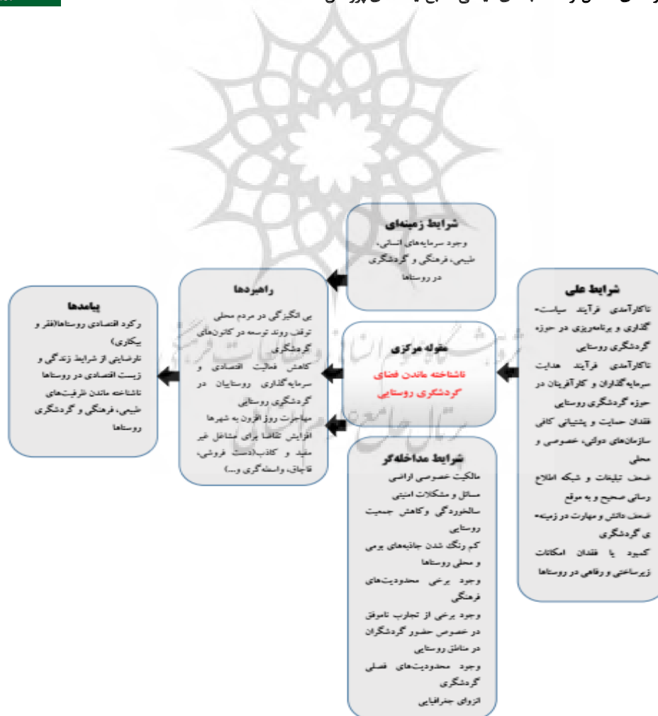
فصلنامه پژوهش‌های روستایی