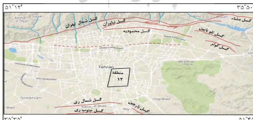
شکل ۲- گسل‌های اصلی تهران که براساس گزارش شماره ۵۶ سازمان زمین‌شناسی کشور (۱۳۷۱) و همچنین گزارش ریتز و همکاران (۲۰۱۲) بر روی نقشه توپوگرافی سه بعدی ۱:۲۰۰۰۰۰۰ بازترسیم شده است.