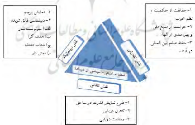
(Bruns, 2014: 31)