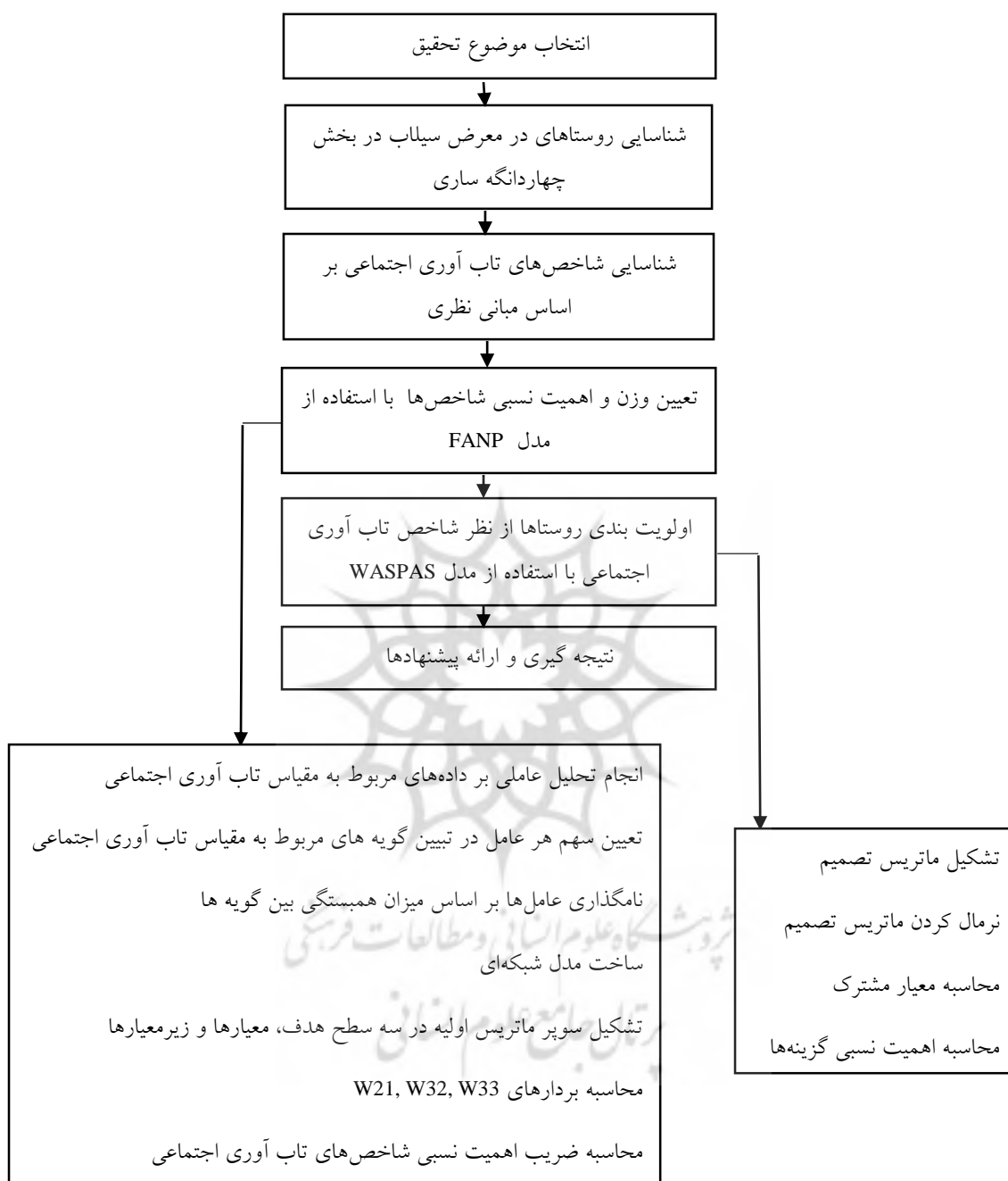
شکل ۱- مدل اجرایی تحقیق