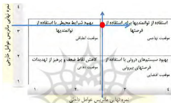
شکل (۲): نمره نهایی ماتریس عوامل خارجی و داخلی

امتیاز نهایی از ضرب ضریب در رتبه به دست می آید. جمع نمره نهایی از ۱ تا ۱/۹۹ نشان دهنده ضعف داخلی سیستم است. نمره ها از ۲ تا ۲/۹۹ نشان دهنده وضعیت متوسط سیستم و نمره های ۳ تا ۴ بیانگر این است که سیستم در وضعیت عالی قرار دارد (ترکمن نیا و همکاران، ۱۳۹۰: ۹۱)