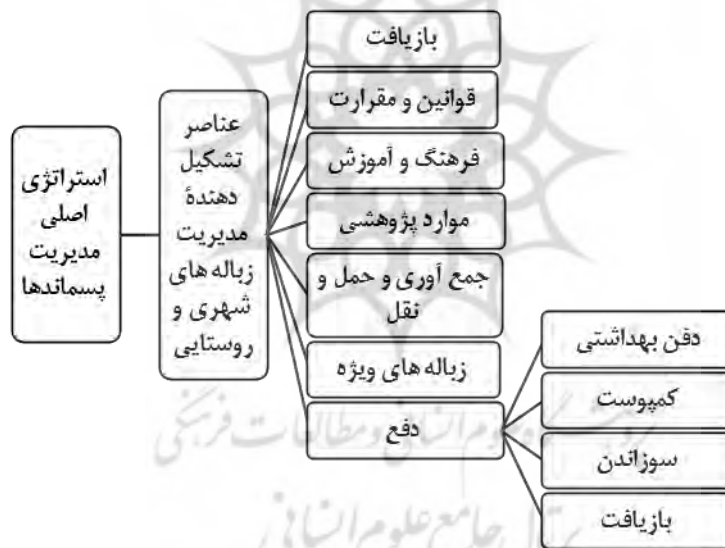
شکل (۲): نمودار استراتژی اصلی مدیریت پسماندها (عمرانی، ۱۳۸۹)

تجزیه و تحلیل SWOT اصطلاحی است که برای شناسایی نقاط قوت و ضعف داخلی و فرصت ها و تهدیدهای خارجی که یک سیستم با آن روبه روست به کار برده می شود با استفاده از این مدل از طریق تجزیه و تحلیل و سنجش محیط داخلی و نقاط ضعف ناحیه به نقاط ضعف و قوت درونی شناسایی شده و همچنین با جستجو در عوامل تأثیرگذار محیط خارجی فرصت ها و تهدیدهایی بررسی می شوند (مافی - سقایی ۱۳۸۸: ۳۰).