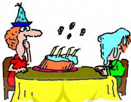
1. Blow it

اصطلاح زبانی و کارتون را رقم زده است. برای روشن‌تر شدن مطلب، تحلیل چهار مورد از کارتون‌ها ارائه می‌شود: