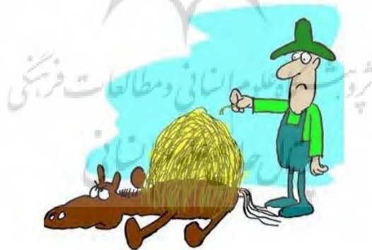
2. The Last Straw

باورها به تکان در می‌آیند و ارزش جدیدی ساخته می‌شود که مبنای آن همان رابطه حسی - ادراکی است که شوشگر دیداری با دنیایی که با آن روبه‌رو است، برقرار می‌کند (شعیری، ۱۳۸۵: ۱۹۶ - ۱۹۷). بُعد عاطفی گفتمان نیز در این کارتون به چشم می‌خورد به این صورت که عکس-العمل کسی که شمع‌ها را فوت کرده و سبب خرابکاری شده است، او را به عاملی موضع‌دار بدل کرده که حس شرمندگی را در گفته‌یاب ایجاد می‌کند و سبب می‌شود که او به ارزیابی عاطفی این تصویر بپردازد. پس، شناختی شوشی یا رخدادی در گفته‌یاب شکل می‌گیرد. عامل موضع‌دار عاملی است که نسبت به جریانی، دیدگاهی شخصی از خود بروز می‌دهد. دمیدن و فوت کردن در مورد چیزهای مختلفی می‌تواند انجام شود؛ ولی انتخاب اتفاقی معمول و ملموس مثل فوت کردن شمع کیک تولد، انتخاب بسیار مناسب و هوشمندانه‌ای در شکل‌گیری روایتی است که به درک معنای این اصطلاح زبانی منجر می‌شود. پس، اصطلاح blow it از طریق این کارتون به‌طور خلاقانه‌ای توسعه یافته و در این کارتون گونه‌های گفتمانی شناختی، حسی - ادراکی، عاطفی و زیبایی‌شناختی محقق شده است. در بررسی میدانی صورت گرفته، تعامل این کارتون با اصطلاح زبانی مرتبط، سبب شده است تا حدود ۸۹ درصد از زبان‌آموزانی که در ابتدا معنی اصطلاح را اشتباه تشخیص داده بودند، پس از رویارویی با این کارتون، جواب درست را انتخاب کنند که این میزان بالاترین نرخ پاسخ درست بعد از تعامل اصطلاح با کارتون بوده است و نشان می‌دهد که این کارتون مؤثرترین کارتون در میان ۱۵ کارتون مورد بررسی است.