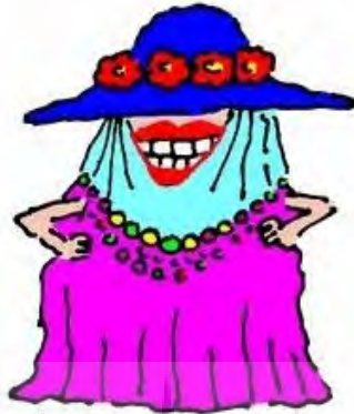
3. Dressed to the Teeth

تصویر شماره ۳، زنی خندان را نشان می‌دهد که لباس‌های زیاد و رنگارنگی پوشیده است به طوری که به جز دست‌ها و دهانش سایر قسمت‌های بدنش با لباس پوشانده شده‌اند. در این کارتون تلاش شده است تا معنای تحت‌اللفظی عبارت زبانی کاملاً به تصویر کشیده شود. زنی که در کارتون حضور دارد تا دندان لباس پوشیده است و هر تکه از لباسش یک رنگ دارد به طوری که هیچ‌گونه هماهنگی با هم ندارند. تناظر کامل میان متن تصویری با متن کلامی سبب ایجاد فشارهای قوی در این تصویر شده است. با توجه به اینکه هیچ عنصر هدایتگری در تصویر وجود ندارد تا بتواند این فشاره را به سمت گستره پیش ببرد، گویی مخاطب با تصویری مواجه است که زمان در آن منجمد است و به جز تعبیر از طریق معنای تحت‌اللفظی عبارت زبانی، چاره دیگری ندارد. مشاهده پاسخ‌های زبان‌آموزان، در بررسی میدانی، نشان می‌دهد که حضور این کارتون در کنار عبارت زبانی، نه تنها سبب تشخیص درست معنای عبارت زبانی نشده است؛ بلکه سبب شده تا ۸۲ درصد پاسخ‌های درست زبان‌آموزان به عبارت زبانی، بعد از مشاهده کارتون تبدیل به پاسخ غلط بشود. بررسی گزینه‌ها نشان از آن دارد که حدود ۷۸ درصد از پاسخ‌های درستی که غلط شده‌اند، گزینه «الف»، یعنی «تا دندان لباس پوشیدن» و تنها حدود ۲۲ درصد گزینه «ب»، یعنی «لباس پوشیده به تن کردن» بوده است. این نشان می‌دهد که کارتون مذکور زبان‌آموزان را از معنای اصطلاحی به سمت معنای تحت‌اللفظی برگردانده است و صرفاً بازنمودی از معنای ترکیبی عبارت زبانی بوده است.