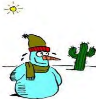
4. Snow Job

در تصویر شماره ۴ یک آدم‌برفی به رنگ آبی دیده می‌شود، در حالی که عرق می‌ریزد و با پوزخندی بر لب به کاکتوسی که در سمت راست و عقب تصویر است نگاه می‌کند. خورشید سوزان، کاکتوس بیابانی موجود در تصویر و عرقی که از سر و صورت آدم‌برفی می‌ریزد نشان از گرما و بیابانی بودن فضای تصویر شده دارد. تنها نقطه اتصال میان عبارت زبانی و تصویر، برفی بودن جنس آدم برفی - آن هم بر اساس شناخت ناشی از تجربه - است. از طرف دیگر، حضور آدم‌برفی در بیابان گرم آن هم در حالی که به‌نظر خوشحال می‌آید سرشار از تناقض و ناپیوستگی است، به‌طوری که ربط منطقی برای شکل‌گیری یک روایت در ذهن ایجاد نمی‌شود. عدم موفقیت کار تو نیست در برقراری اتصال اولیه درست میان تصویر و عبارت زبانی سبب شده است تا فضای تنشی لازم برای توسعه خلاق عبارت زبانی به درستی شکل نگیرد؛ اما حتی اگر برفی بودن آدم‌برفی را نقطه حرکت به سمت معناسازی و لبخند زیرکانه آدم‌برفی آبی رنگ را به‌منزله موضوعی که سبب انفصال و حرکت به سمت گستره شده است، در نظر بگیریم. این لبخند زیرکانه مخاطب را به هیچ‌کجا هدایت نمی‌کند؛ زیرا مسیر حرکت جهت‌مند و پیوسته نیست. عناصری که تصویر شده‌اند، پُر از تناقض هستند به‌گونه‌ای که نمی‌توان از کنار هم قرار دادن آن‌ها روایتی معنی‌دار ساخت. به‌نظر می‌رسد کارتون‌نویست قصد دارد تا دنیایی جدید خلق کند و به این ترتیب شناختی درون‌گفتمانی را شکل دهد؛ اما نه تنها موفق به انجام این کار نشده است؛ بلکه متنی گسسته و پراکنده ساخته است که حتی از طریق ارجاع به عالم خارج و شناخت حاصل از تجربه قلبی هم نمی‌توان نظام خاصی را برای آن متصور شد. آمار حاصل از بررسی میدانی نیز نشان