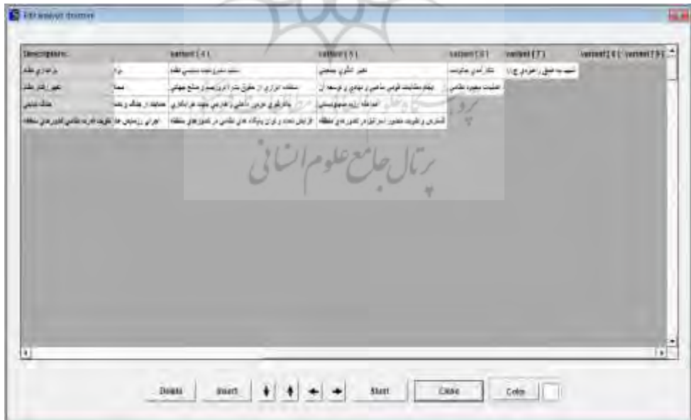
شکل (۲) تعریف مؤلفه‌های کیفی بدیل برای نرم افزار - بخش دوم