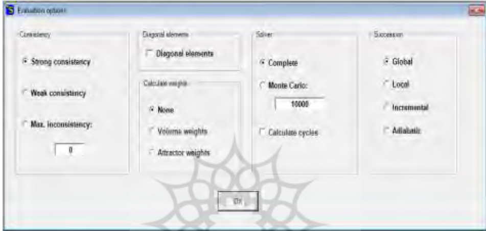
شکل (۵) پنجره Evaluation Options